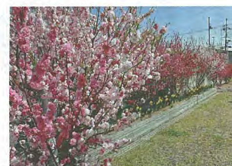
【写真】 「花いっぱいのフラワー公園」 (八幡月夜田) 花のように美しい心を育てましょう。

※みなさんの作品で、広報やわたの紙面を飾ってみませんか。応募作品の一部を、このコーナ ーで紹介します。作品は俳句、川柳、短歌、イラスト、写真、詩など(写真、イラストに関し ては、100字程度で説明を添えてください)。1人1作まで。毎月5日までに、住所、氏名(ふ りがな)、電話番号を明記して、〒614-8501市役所秘書広報課「作品」係へ送ってください。