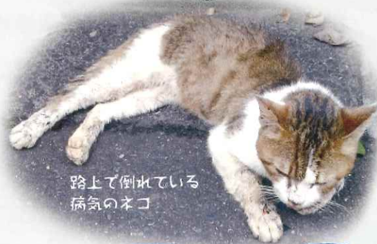
路上で倒れている病気のネコ