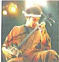
南の風人まーちゃんバンド

定員 先着150人(申込不要) 【その他】▶被災地の子どもたちが描いたメッセージ展▶保育園、小中学校、児童センター等の作品展示、活動紹介、舞台発表▶バザー、模擬店等 申込み・問合せ 八幡人権・交流センター(☎981-3127)