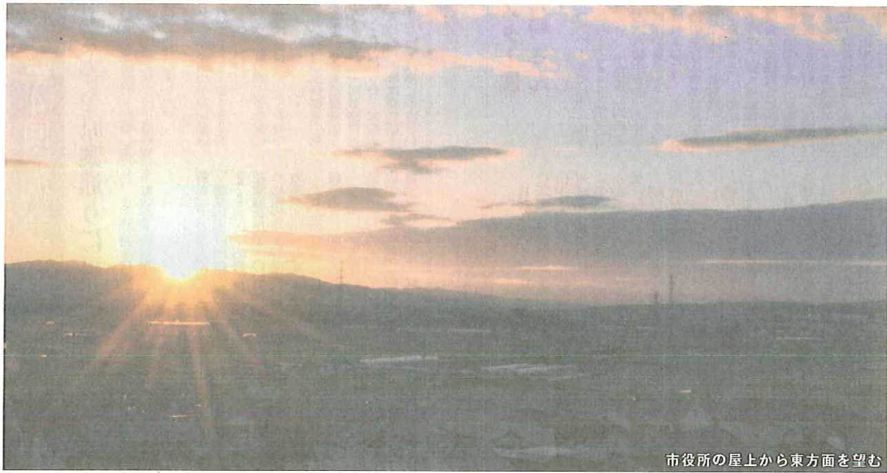
市役所の屋上から東方面を望む