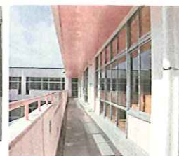
飛散防止フィルムが貼られたガラス