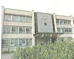
工事が完了した南校舎

放送設備の更新、トイレの洋式化等美装改修、廊下および階段に防滑性シートを貼り付け、窓ガラスに飛散防止フィルムの貼り付け