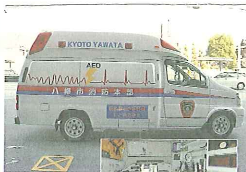
①高規格救急自動車 ②高規格救急自動車の内部