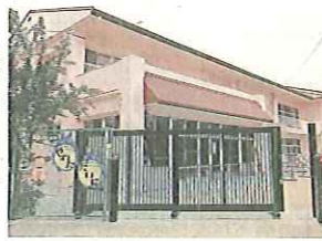
工事が完了した園舎