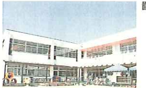
工事が完了した園舎