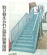
取り替えられた屋外鉄骨階段