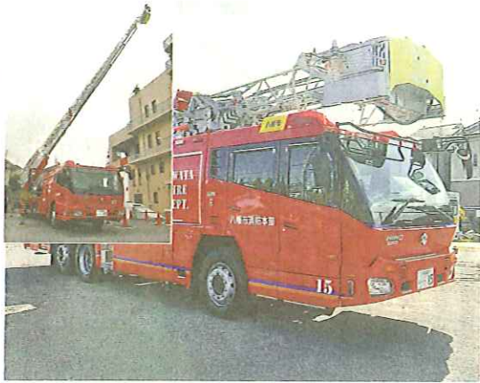
30m級はしご付消防自動車

し、心筋梗塞等の心疾患を鑑別し、適切な医療機関を選定することで救命率を高めます。乗車定員は7人、4輪駆動で、車体の右側にAED