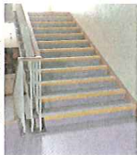
防滑性シートが貼られた廊下と階段

放送設備の更新、トイレの洋式化等美装改修、廊下および階段に防滑性シートを貼り付け、窓ガラスに飛散防止フィルムの貼り付け