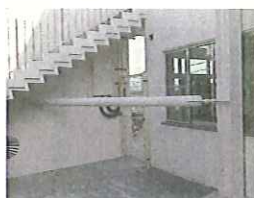
鉄骨材で補強された階段