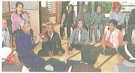
AED講習を受ける高齢者の皆さん