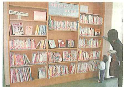
図書館で本を選ぶ親子

市では、平成17年3月に「八幡市子どもの読書活動推進計画」読書環境の整備をめざした「5カ年計画」を策定しました。このたび、この5カ年の成果と課題をもとに、新たな「八幡市子どもの読書活動推進計画(第二次計画)」策定にむけて素案をまとめました。