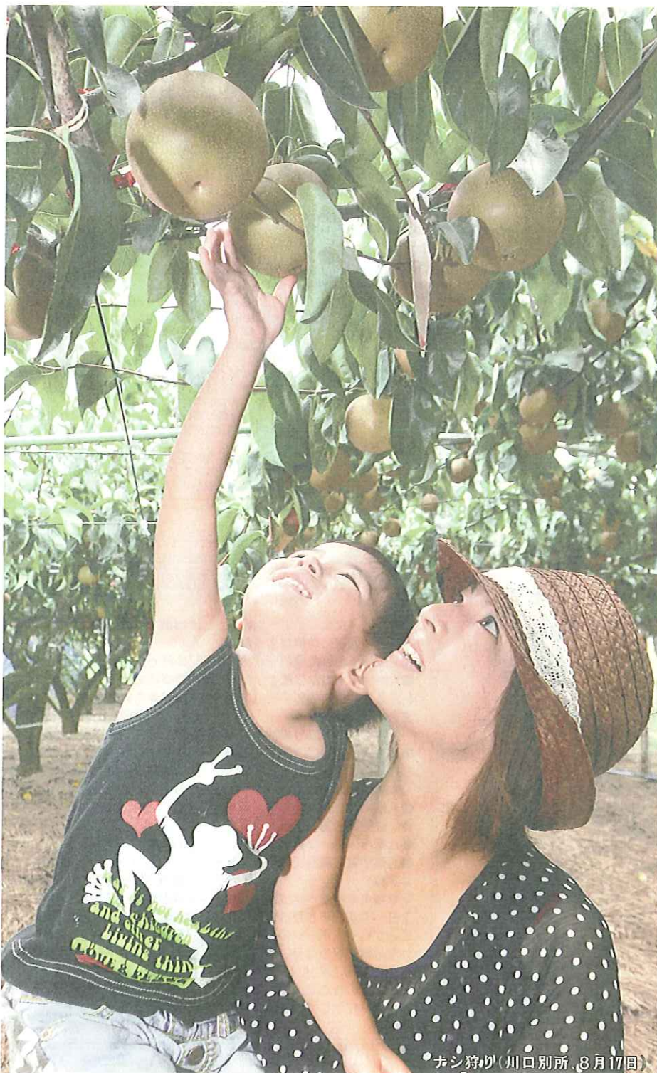
カン狩り(川口別所、8月17日)