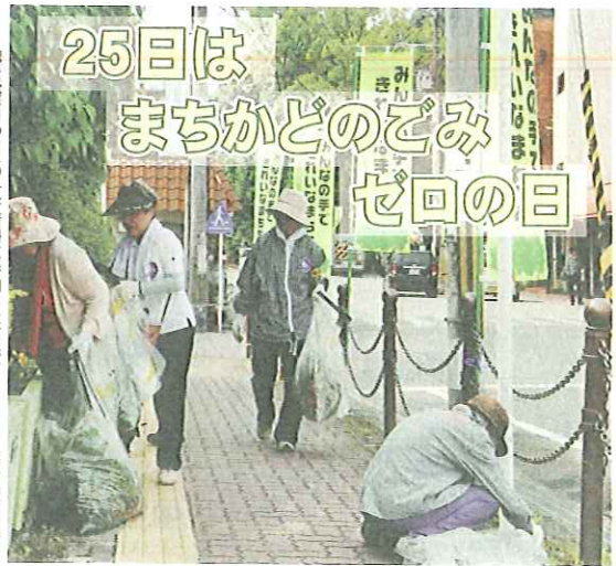
「ごみゼロの日」の一斉清掃に参加した市民。6月5日、八幡市駅周辺

市は9月25日(日)を「まちかどのごみ」ゼロの日として、道路や公園の一斉清掃(小雨決行)を実施します。ご協力いただける人は午前9時、活動しやすい服装で①または②の清掃(集合)場所にお集まりください。軍手やゴミ袋は用意します。