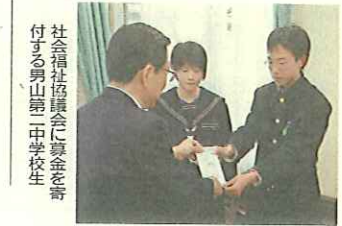
社会福祉協議会に募金を寄付する男山第一中学校生

・ご協力ありがとうございました。 引き続き、市役所と社会福祉協議会では、義援金を受け付けます。 ◆問い合わせ 福祉総務課・社会福祉協議会