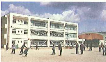
耐震補強された橋本小の校舎