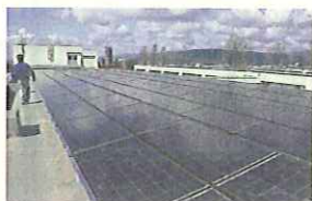
男山二中学校の屋上に設置された太陽光パネル