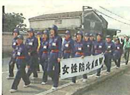
新しい活動服で、市民主催のイベントなどに参加する隊員

同推進隊は女性のみで構成され、今年新しい活動服を全員に配備。1人暮らしの高齢者宅を訪問し、防火点検を行うなど、地域の火災予防や啓発活動に取り組んでいます。