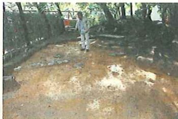
大塔の礎石と抜き取り穴

市教委は11月6日、石清水八幡宮境内(八幡高坊)の発掘調査で見つかった大塔跡と瀧本坊跡を公開しました。いずれも明治初年の神仏分離令により失われた仏教関係建物の遺構です。