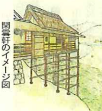
閑雲軒のイメージ図

大塔跡 中世以来、八幡宮には男山(四十八坊)といわれる多数の宿坊(小寺院)がありました。その一つである瀧本坊は、江戸時代の社僧で書家・画家の松花堂昭乗(1584年～1639年)