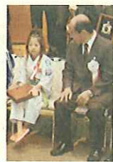
スポーツ賞最年少の吉田さんと話をする市長