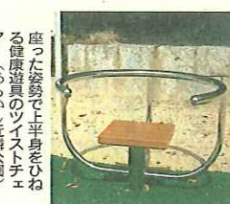
健康遊具は、子どもから高齢者まで楽しみながら気軽に体力作りをすることができます。散歩の途中にちよっとストレッチ。無理をせずに利用してください。