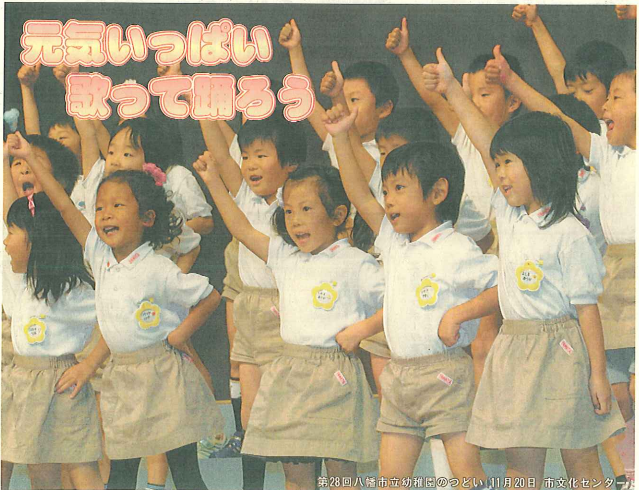
第28回八幡市立幼稚園のつどい 11月20日 市文化センター