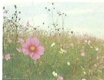
【写真】「風に揺れるコスモス畑」 匿名希望

※みなさんの作品で、広報やわたの紙面を飾ってみませんか。応募作品の一部を、このコーナーで紹介いたします。作品は俳句、川柳、短歌、イラスト、写真、詩など(写真、イラストに関しては、100字程度で説明を添えてください)。1人1作まで。毎月5日までに、住所、氏名(ふりがな)、電話番号を明記して、〒614-8501市役所秘書広報課「作品」係へ送ってください。