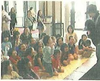
昨年度市民文化祭の人形劇

日時 10月30日(土)午前9時30分～午後5時、10月31日(日)午前10時～午後4時 場所 文化センターおよびその周辺 内容 【展示】書、絵画、写真、陶芸、手工芸、文芸(短歌・俳句などの展示)、生花、園芸等 【舞台】コーラス、歌謡、日本舞踊、民舞、ダンス、バレエ、謡曲、詩吟、民謡、三曲、大正琴、和太鼓等 【その他】模擬店、体験ひろば