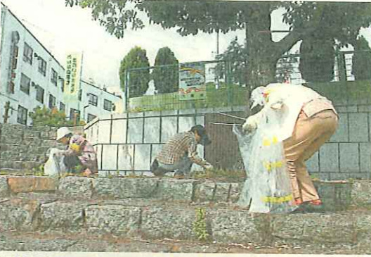
道路を清掃する高校生(男山地域)