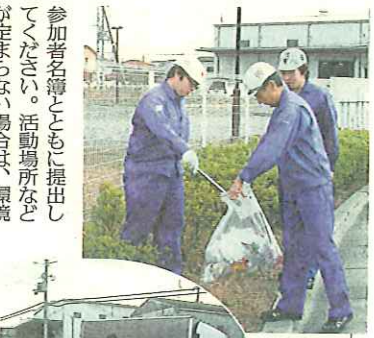
会社の周りを清掃する従業員(上津屋工業団地)

26日はまちかどのごみゼロの日 市は9月26日(日)、道路や公園の一斉清掃(小雨)を実施します。ご協力をお願いします。 ◆問い合わせ 環境保全課