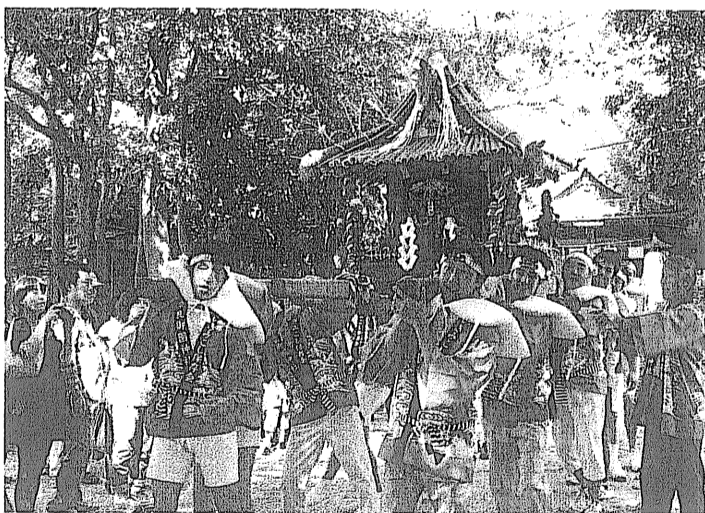
威勢のよい掛け声とともに「ずいき神輿」を担ぐ若者

神前に野菜などを祭り、祝詞があげられた後、本殿前の境内で、てんぐの面をつけた子どもや獅子舞姿の若者2人が登場。舞などの奉納に見物客から大きな歓声が上がりました。