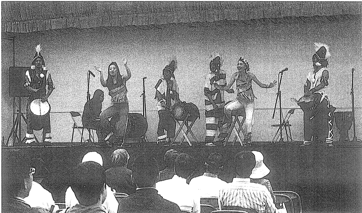
太鼓の音にあわせ軽快なダンスを披露

歴史と自然と景観にふれ、三川合流域の魅力味わう「第4回淀川三川ふれあい交流」が10月17日、淀川河川公園背割堤地区で行われました。 淀川三川ふれあい交流実行委員会が主催。関係団体と連携し、交流活動の取り組みを進めるとともに、三川合流域から広く情報発信を行うことを目的に催されました。 演奏やダンスのほか、バードウォッチングやスタンプラリーなどの多彩なイベントが