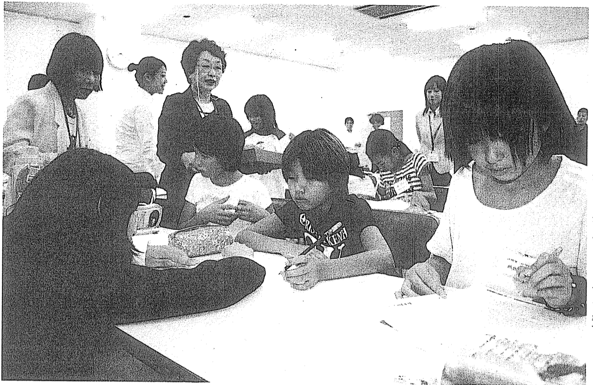
放課後に黙々と自分で選んだ問題にチャレンジする児童

この日は、同クラブに登録した八幡第二小と四小の5、6年生45人が学習。児童は、パソコンから学習したい科目を選択し、プリントを印刷。自己採点后、発展問題に進むか、基本問題を繰り返すかは自らが判断します。また、補助員として学習アドバイザーを配置。児童の質問に応じます。 土曜日には、漢字検定や数学検定合格に向けたチャレンジ学習も実施。来年度以降は対象校を増やす予定です。