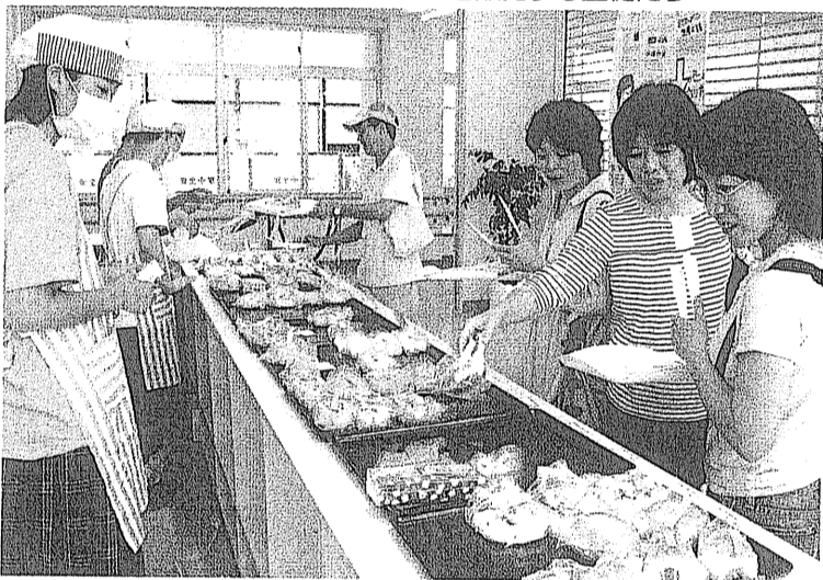
「きろろん八幡」製のパンを販売する生徒たち