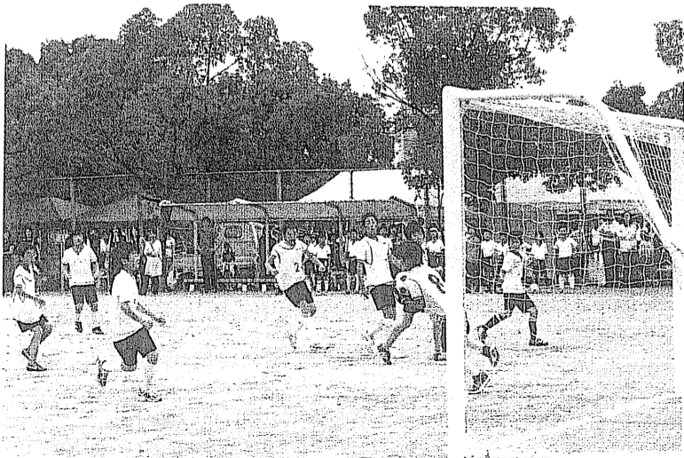
相手選手のシュートを受けとめるゴールキーパー