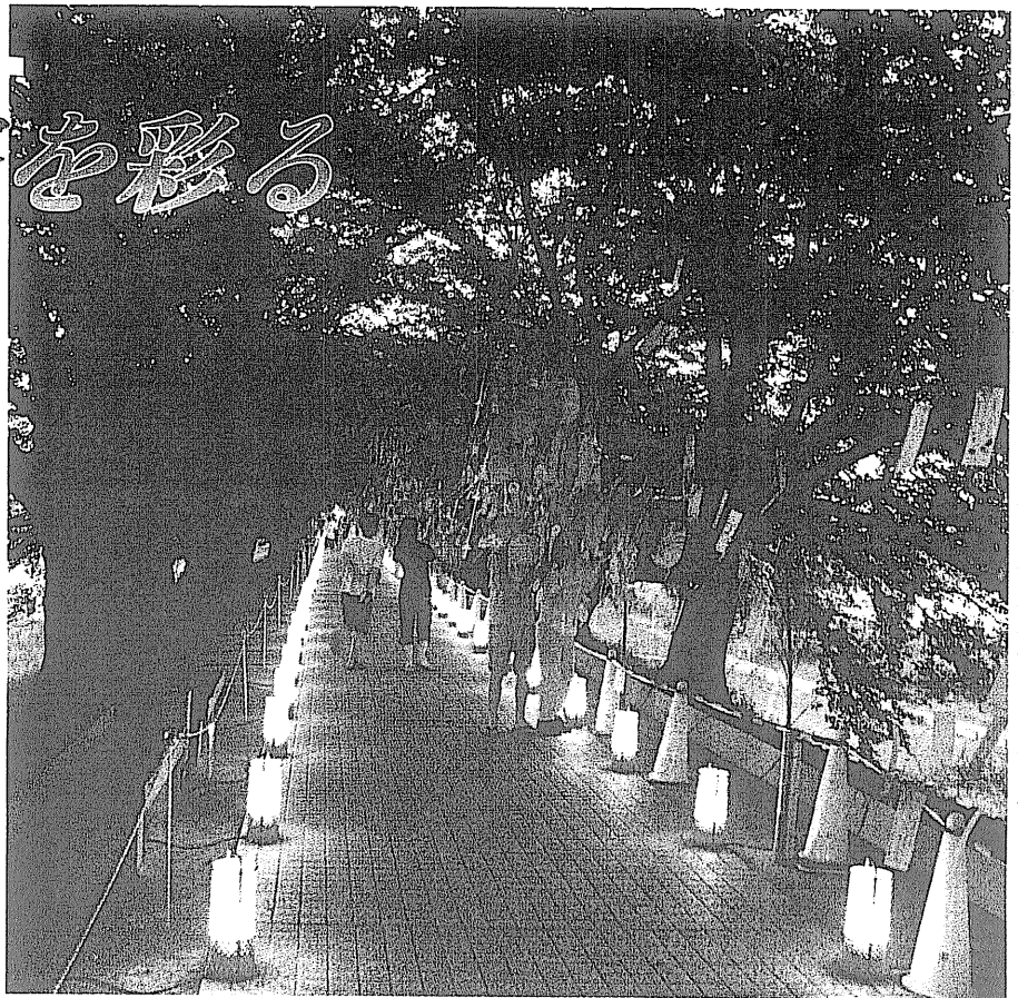
ライトアップされた園路を散歩する市民(背割堤、7月5日)