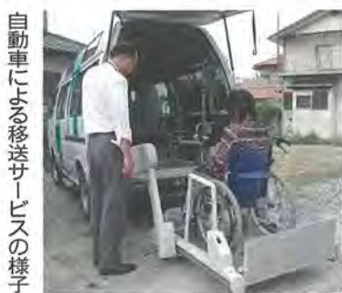
自動車による移送サービスの様子

▽対象 市内在住・在勤・在学の満20歳以上75歳未満で、平日の昼間に開催する会議に出席できる人 ▽募集人数 1人 ▽任期 平成26年2月7日から3年間 ▽応募方法 「福祉有償運送が担っているもの・意義について」をテーマにした小論文(4000字詰め原稿用紙2枚程度)に住所、氏名、生年月日、性別、電話番号を記入し、(〒614-8501市役所)福祉総務課へ郵送または直接提出。