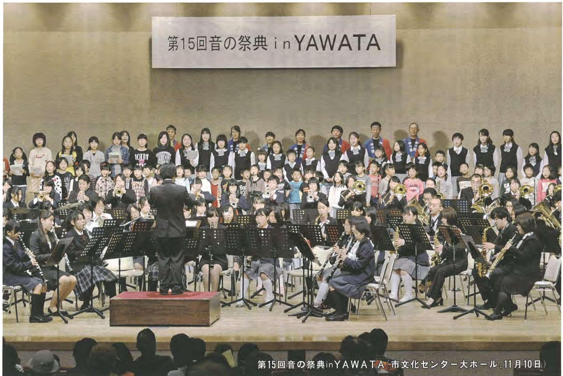
第15回音の祭典inYAWATA (市文化センター大ホール、11月10日)