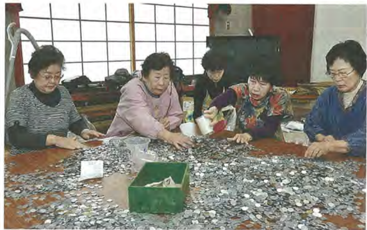
硬貨などの仕分けをする女性会員たち

会員たちは指先を真っ黒にしながらも、手際よく硬貨を1円玉とそれ以外に仕分け、袋に詰め込んでいました。市内7カ所の郵便局で集計された合計金額は114万9千137円。全額が市に寄付され、福祉に役立てられます。