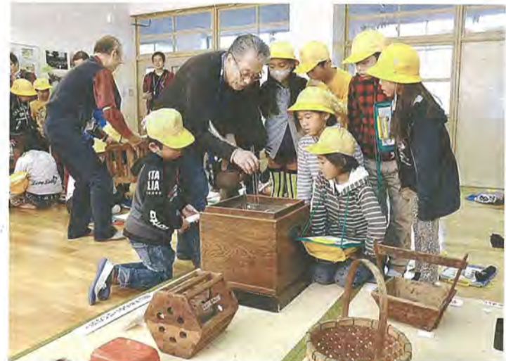
火鉢の説明を聞く子どもたち