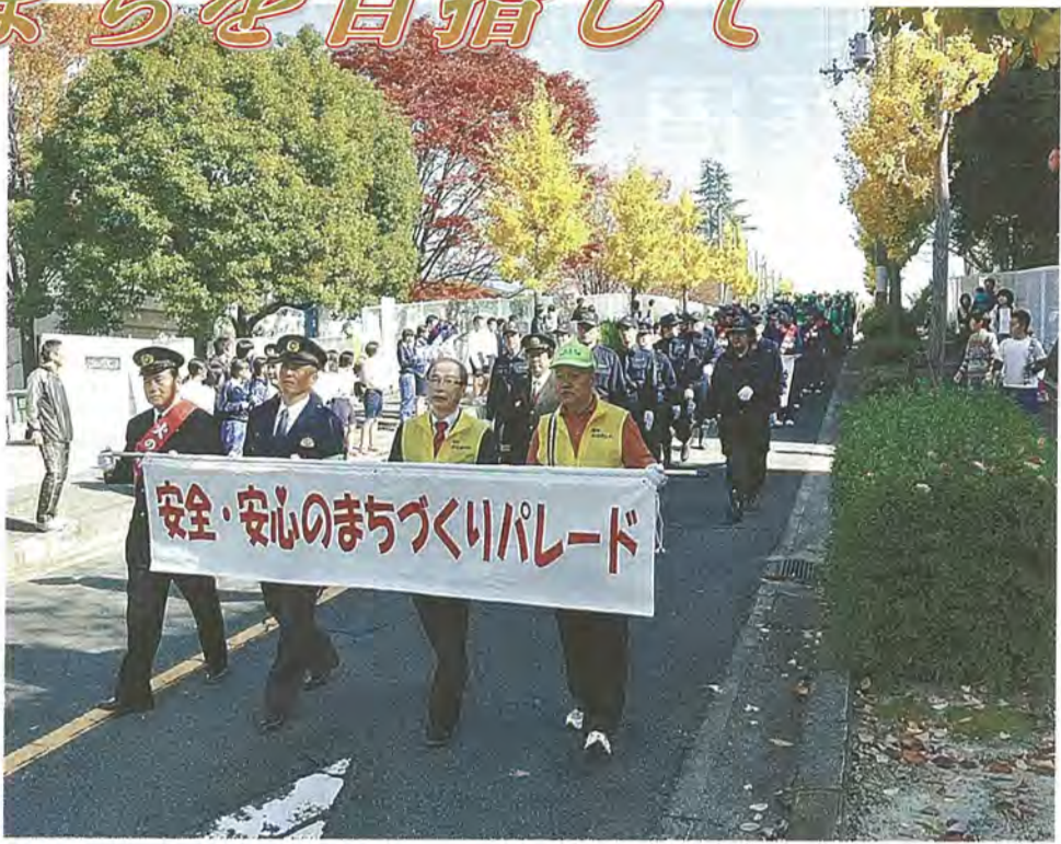
▲ プラカードを掲げる参加者たち

地域一体となって犯罪を防ごうと「安全・安心のまちづくりパレード」が11月23日、さくら小学校地区周辺で開催され、約1000人の参加者が、犯罪のないまちづくりを呼びかけました。 同パレードは、市民の安全意識を高め、犯罪のないまちづくりを進めようと、八幡市自治連合会が主催。市内を6地区に分けて平成16年度から毎年行われており、今回で節目となる10回目を迎えました。