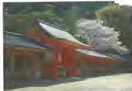
昨年度観光協会会長賞「頓宮の春景色」

テーマ 「八幡の四季」(八幡の自然景観、文化財、風俗、伝統的祭事、その他観光施設等) 応募写真規格等 ①カラープリント四つ切(ワイド四つ切も可)②観光パンフレット等に使用できるもの③1年以内に撮影し、未発表のもの(合成写真不可)※1人3点以内。 申込み・問合せ 1月31日(金)までに応募票と作品を市観光協会(〒614-8005八幡高坊8-7☎981-1141)へ持参か郵送。応募票は同協会窓口やホームページから入手できます。