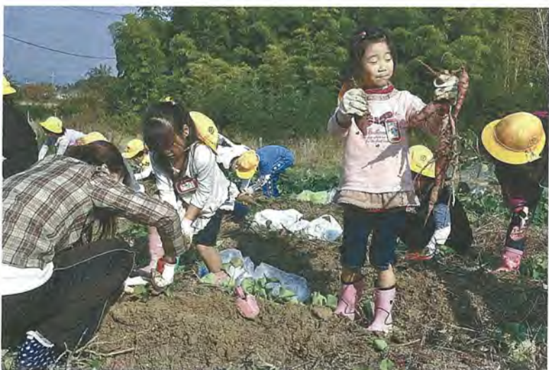
サツマイモを掘る子どもたち

今回収穫したサツマイモは、美濃山小学校では大学イモ、有都小学校では茶巾絞りにして、おいしくいただきました。