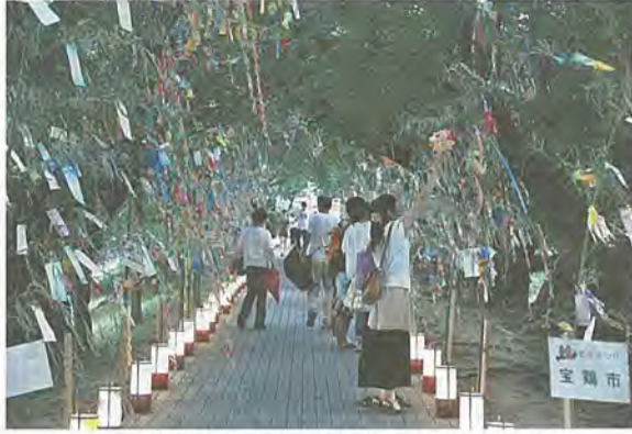
日暮れとともに園路をライトアップ (昨年の七夕まつり)

開催日時：8月9日(金)～11日(日) 午前10時30分～午後8時30分 小雨決行