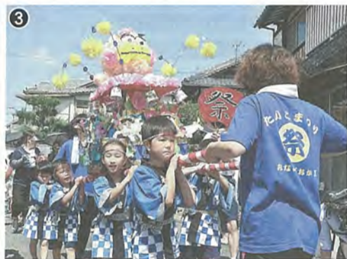
◆威勢のいい掛け声をあげながら参道を練り歩く担ぎ手たち(1) ◆町内を練り歩く南ヶ丘保育園の園児たち(2)と南ヶ丘第二保育園の園児たち(3) ◆屋形太鼓を担ぐ男山中学校の生徒たち(4)