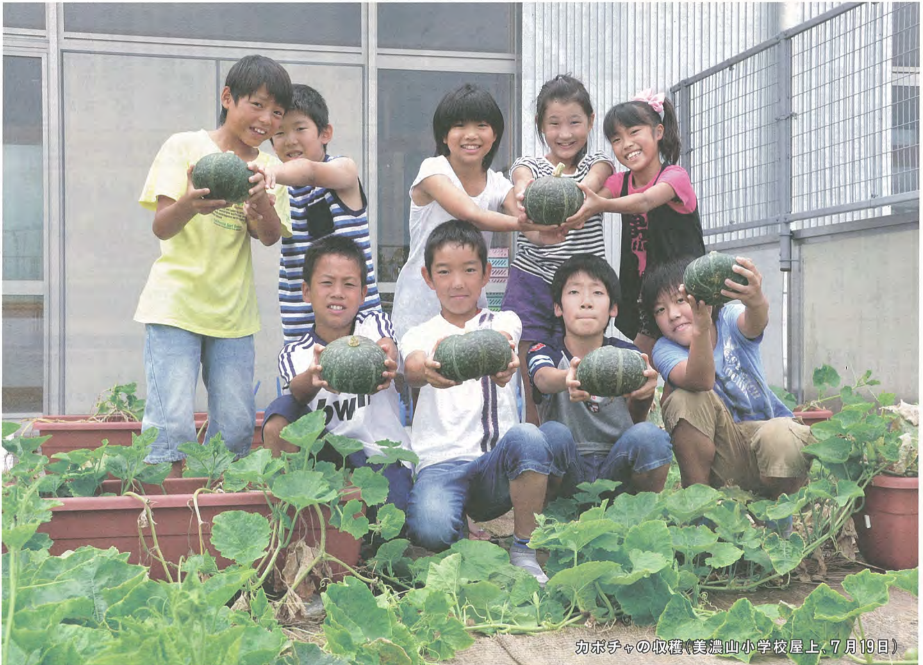
カボチャの収穫(美濃山小学校屋上、7月19日)