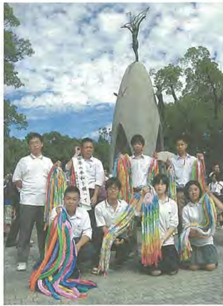
原爆の子の像の前で平和を誓う平和大使(昨年8月6日、広島)

平和大使の中学生らが8月5日、広島平和記念式典(8月6日)に参加するため被爆地「ヒロシマ」に出発します。