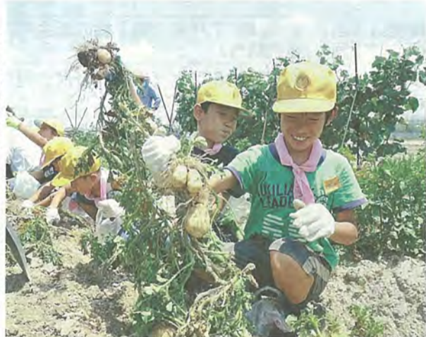
たくさんジャガイモに笑顔の子もたち

会メンバーから植物や肥料の話聞いたあと、うねに沿って横一列に並んで、ジャガイモの茎の周りの土を掘り起こしていきます。そして茎をグツと引っ張ると、土の中から丸いジャガイモが何個も連なって出てきました。それを見た子どもたちは「雪だるまみたい」と、大はしゃぎでした。子どもたちはジャガイモを2株ずつ収穫し、1株は自宅に持って帰り、もう1株は全校児童の9月の給食に使われます。ジャガイモ掘りを終えた子どもたちは「いっぱい採れた」と、とても喜んでいました。