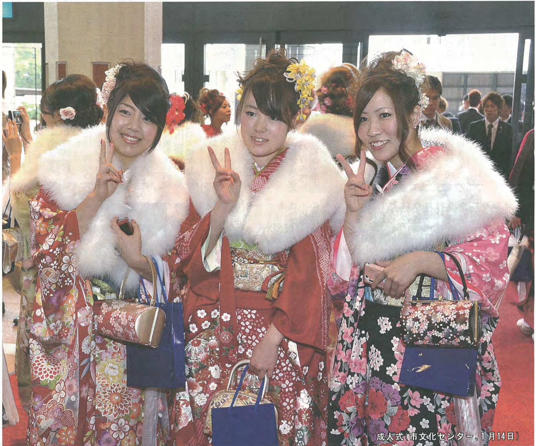
成人式(市文化センター、1月14日)