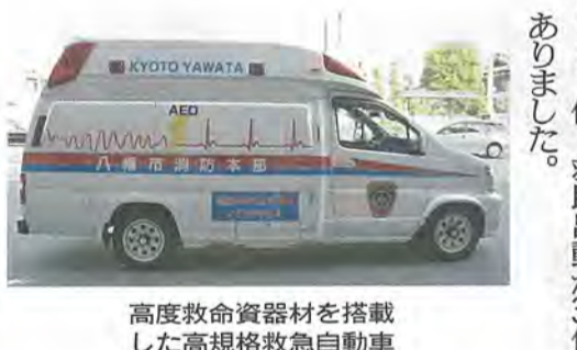
高度救命資器材を搭載した高規格救急自動車

取り付けましたか? 住宅用火災警報器 火災を素早く感知し、音声などで知らせてくれる住宅用火災警報器。 住宅火災による死者の半数以上は65歳以上の高齢者で、夜間、火災に気付くのが遅れ、煙に巻かれて死亡する例が多くあります。 昨年、市内で建物火災が14件発生し、うち住宅火災が3件ありました。2件は住宅用火災警報器を設置していたため、火災をいち早く知り、通報や初期消火が行えたことで、大事には至りませんでした。 あなたと家族の大切な命を守るために、必ず『住宅用火災警報器』を設置しましょう。 また、既に設置されている住宅用火災警報器は、定期的な作動点検をする必要があります。表示されている電池の寿命よりも、短期間で電池切れとなる不具合が発生しています。 日点検も忘れずに実施してください。 ◆問い合わせ 消防本部予防課