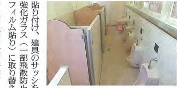
きれいになったトイレ

外壁の全面塗装改修、普通教室の壁・天井等の塗り替え、黒板および掲示物の張り替え、教室と廊下の間仕切り壁の撤去・新設、廊下および階段に防滑