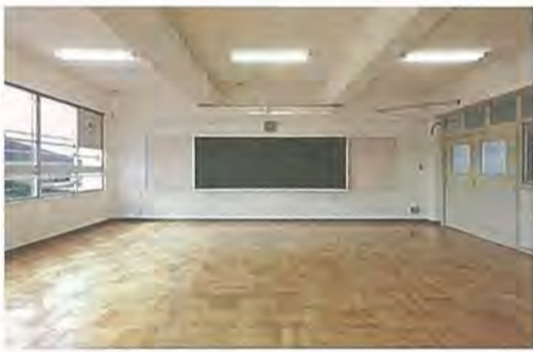
内部改修後の普通教室 ◆問い合わせ 教育総務課

性シートの貼り付け、窓ガラスに飛散防止フィルム貼り付け、照明器具の取り替えと地震時の落下防止対策