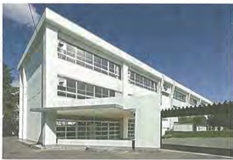
工事が完了した男山第三中学校の南校舎

外壁の全面塗装改修、普通教室の壁・天井等の塗り替え、黒板および掲示物の張り替え、教室と廊下の間仕切り壁の撤去・新設、廊下および階段に防滑