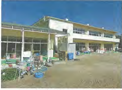
工事が完了した橋本幼稚園

(事業費6千279万円) ・耐震補強工事 ・一部窓を縮小し鉄筋コンクリートの耐震壁に改修