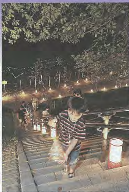
日暮れとともに園路をライトアップ(昨年の七夕まつり)

七夕まつり等ふれあい交流実行委員会と市観光協会は、淀川河川公園背割堤地区で「第4回七夕まつり」を開催します。背割堤地区は木津川、宇治川、桂川が合流する歴史・文化・自然が豊かな地域です。この地域の魅力を広く知ってもらいために、昨年引き続き開催します。今年はいベント内容の充実を図るとともに、12日(日)にはフリーマーケットを開催します。期間中、堤防上の園路には、ササ飾りが並べられ、願い事記載所が設けられます。また、午後6時30分からは園路をライトアップ。夕暮れの堤防に幻想的な光景を作ります。ご家族そろってお越しください。