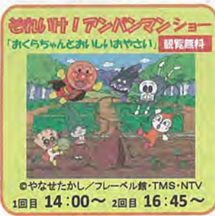
1回目 14:00～ 2回目 16:45～