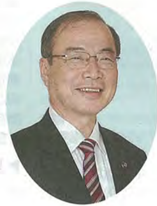
八幡市長 堀口文昭

本市の将来都市像である「自然と歴史文化が調和し、人が輝く、やすらぎの生活都市」の実現に向け、定められた七つの基本目標、なかでも当面は、教育、活力、安心・安全を軸とし、これからのわがまち八幡づくりを進めてまいります。