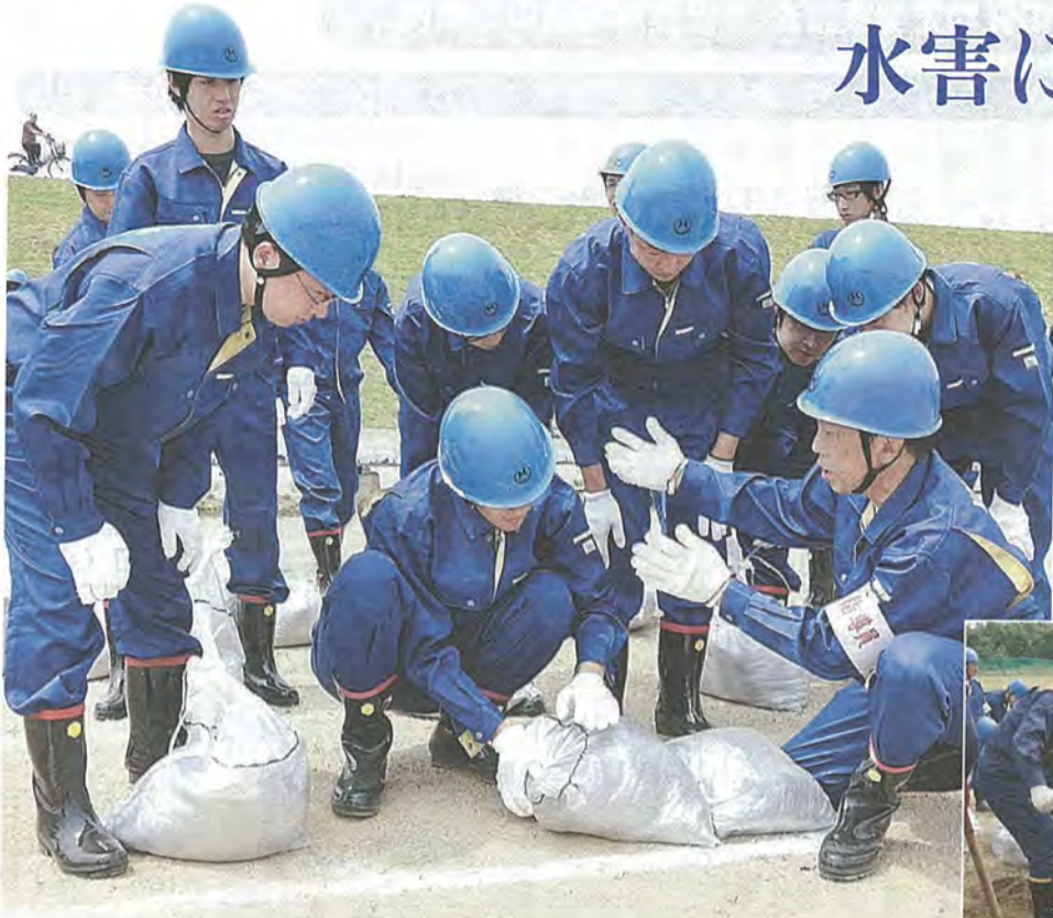
▲ 指導員から工法を教わる市職員