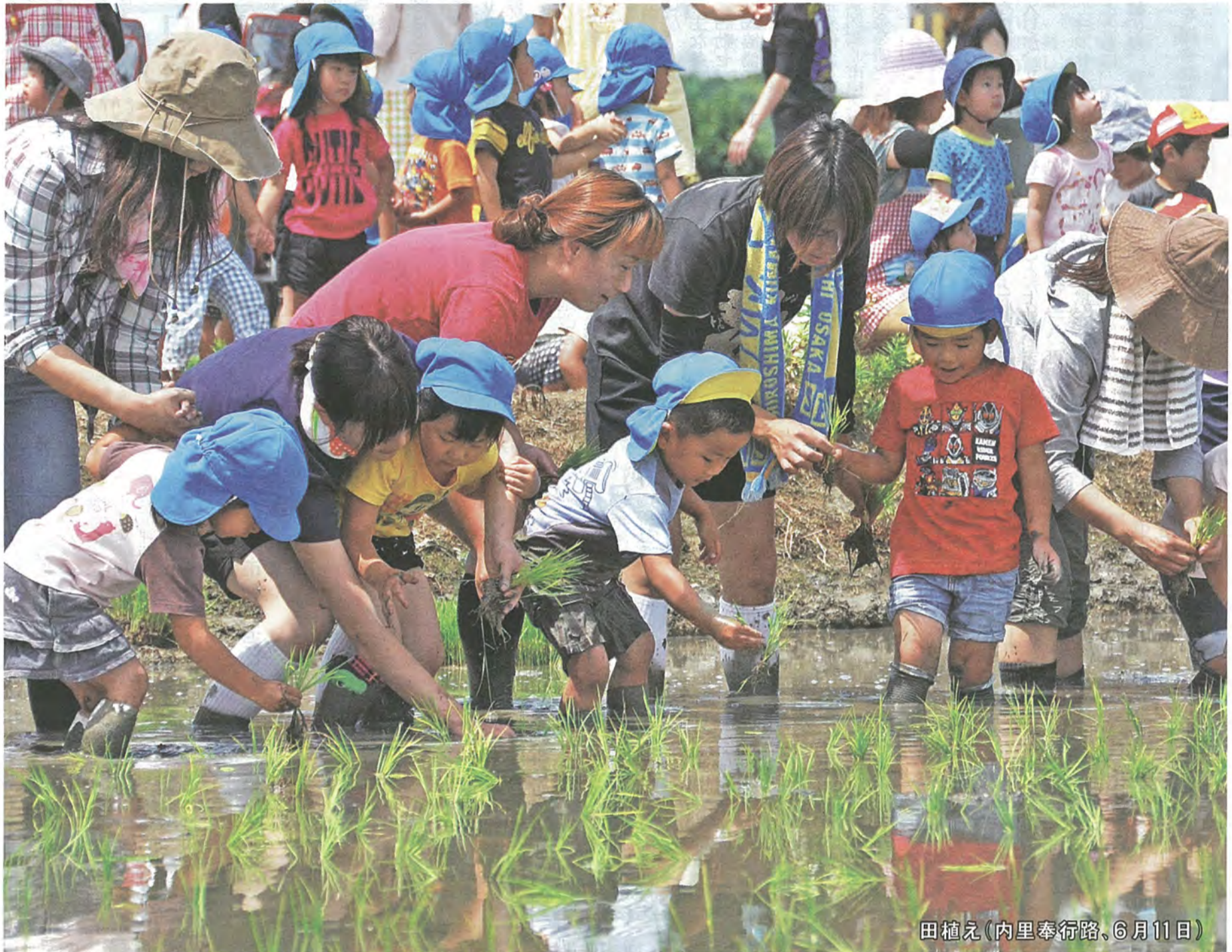
田植え(内里奉行路、6月11日)