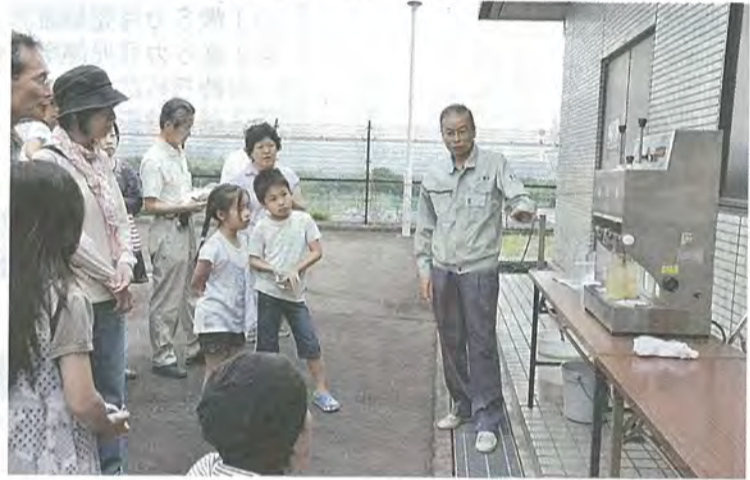
泥水が分離する様子を見つめる見学者たち

このページでは、市民の皆さんの活躍やまちの話題などを紹介しています。身近な話題や、広報紙についての意見を、秘書広報課までお寄せください。