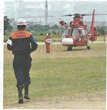
救援物資を受け取りに行く消防署員

梅雨入りを前に、6月2日、川口市民運動公園で市消防団、市役所、消防本部、京都市消防局航空隊が合同で水防訓練を行いました。総勢約150人の参加者は堤防の決壊など最悪の事態を想定し、訓練に励んでいました。 この訓練は水難被害から住民の生命、身体および財産を守るため、水防工法の基礎的技術を習得するとともに、水防体制の強化を図ることを目的にしています。