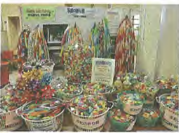
展示された平和の折り鶴 (昨年8月2日、市役所)

市とピース八幡(市非核平和都市推進協議会)は7月2日から27日まで、平和の願いを込めて折った「平和の折り鶴」を募集します。