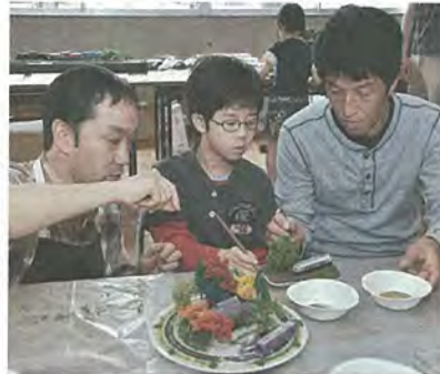
盆フマを作る親子

5月3日～5日、四季彩館で開館10周年記念感謝祭(第一弾)が行われました。会場では、小さな器の上に盆栽風の情景模型を作る盆フマ教室や親子木工教室などの体験教室、日頃の感謝を込めてお楽しみ抽選会などが催され、親子連れでにぎわいました。