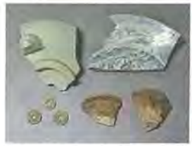
木津川河床遺跡と出土した遺物