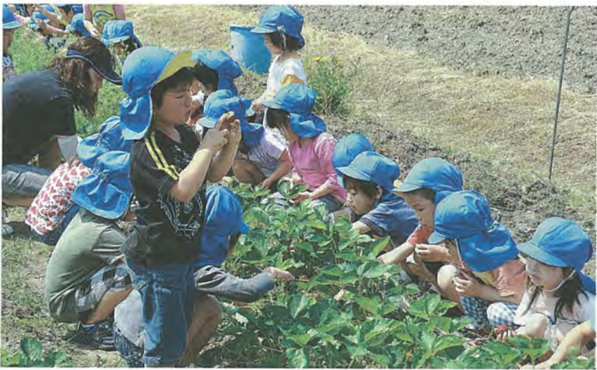
イチゴを探す園児達

イチゴを摘み終えた園児からは「ジャムの匂いがして美味しそう。今すぐ食べたい」と喜びの声が上がっていました。