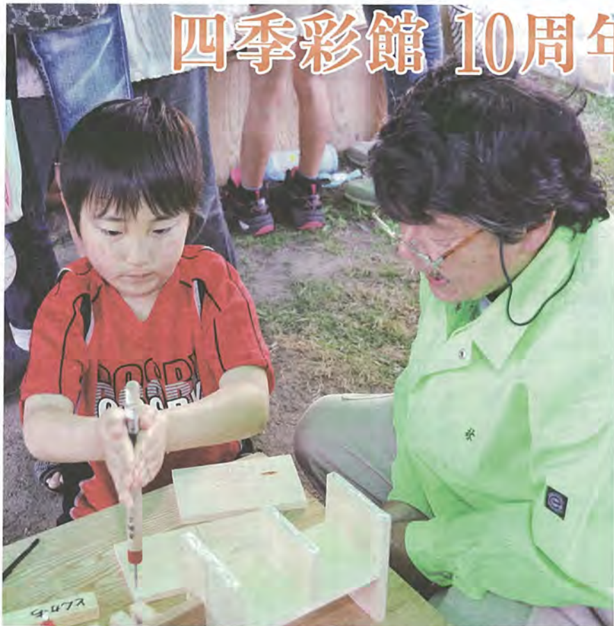
小物入れを作製する子ども