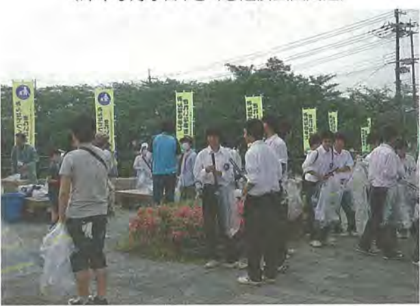
市内一斉清掃に参加した市民の皆さん (昨年6月5日、さくら近隣公園周辺)

市は6月3日(日)を「まちかどのごみゼロの日」として、道路や公園の清掃を実施します。ご協力いただける人は午前9時、活動しやすい服装で清掃(集合)場所にお集まりください。軍手やごみ袋は用意します。