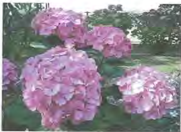
【写真】 紫陽花 匿名希望(八幡園内)

【俳句】 水の上 すべる鷺二羽 影ひきて 藤村みやじ(八幡土井) 三川の 寄り添ふところ 霞かな 吉川せい子(八幡長田) 梅雨空の 憂うつ晴らせし 花菖蒲 岩城光子(男山香呂) 庭園の 芝に落ちたる 夏椿 中村弘子(八幡清水井) 【短歌】 新緑の 眺望誘う 季節花 一枚の絵図 車窓のかなた 今村和子(岩田竹綱) 水鳥や 亀や小鮒や 呼びよせて 春の水辺は 命あふるる 品川正次(八幡舞台) 夏風や 紫陽花冴ゆる 一雨に 菜に蝸牛 植村佳津子(男山指月)