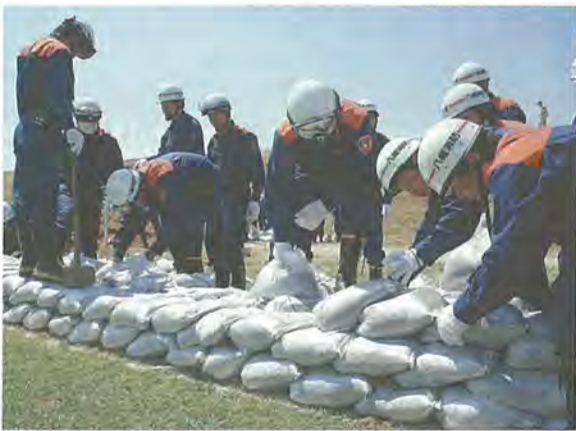
積み土のう工法に取り組み消防職員ら(平成22年6月5日、川口市市民運動公園)

市は雨季を前に6月2日、木津川左岸堤防(川口市市民運動公園)で水防訓練を行います。