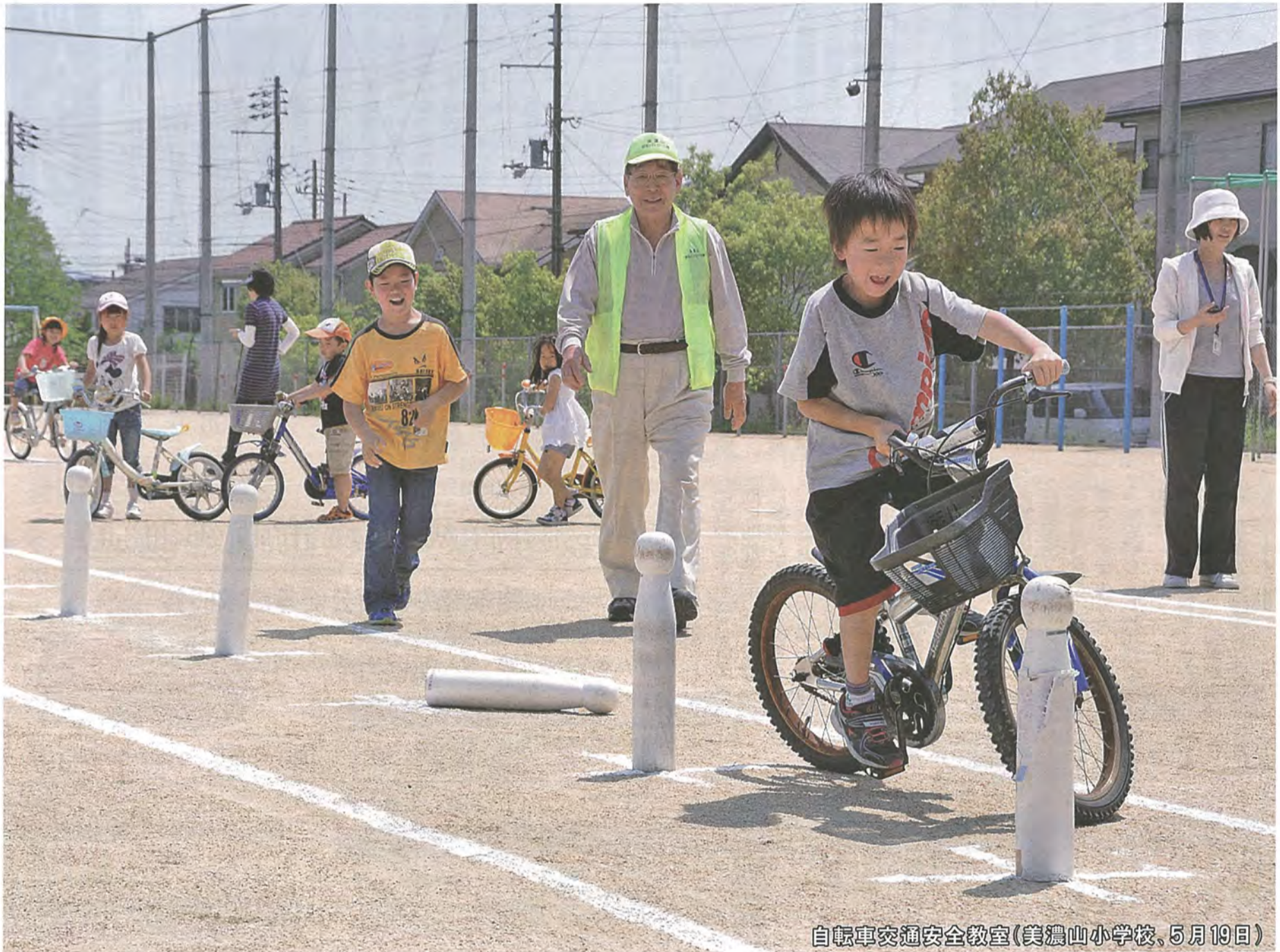
自転車交通安全教室(美濃山小学校、5月19日)