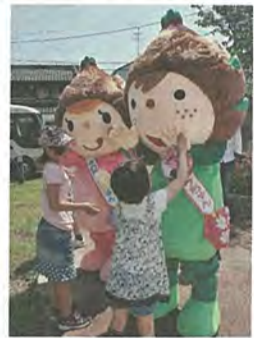
タケちゃん(右)、ノコちゃん(左)と遊ぶ子ども達

は市商工会オリジナルキャラクターのタケちゃん、ノコちゃんも訪れ、感謝祭を盛り上げていました。NPO法人「とんかち」による親子木工教室では、参加した親子連れがカナツチやノコギリを使って、椅子型の花台や手提げ式小物入れなどを協力しながら完成させました。