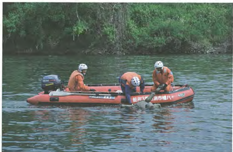
遭難者に見立てた人形を引き上げる消防署員(5月16日)