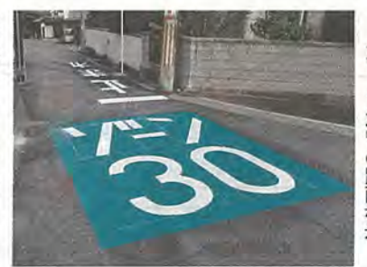
「ゾーン30」の路面標示

市では、引き続き通学路や地域の生活道路の安全対策に取り組み、さまざまな啓発活動を実施していきます。皆さんのご協力をよろしくお願いいたします。 ◆問い合わせ 管理・交通課、道路河川課