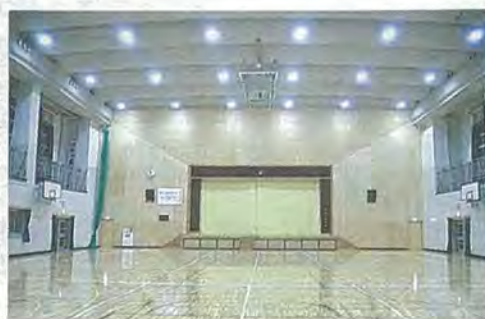
老朽改修後の屋内運動場 ◆ 問い合わせ 教育総務課

屋内運動場の老朽改修工事を行いました。主な工事の内容は、屋根防水改修、外壁補修、内装改修、照明器具更新、放送設備改修などです。内装改修は、内壁塗り替え、床フローリングの改修、建具のサッシの改修などで、新しい建具サッシには強化ガラス(一部飛散防止フィルム)を使用しています。また、体育用具の更新やトイレの美装改修も行い、新たに多目的トイレを設置しました。