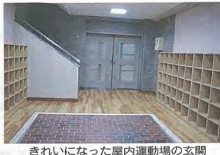
きれいになった屋内運動場の玄関

屋内運動場の老朽改修工事を行いました。主な工事の内容は、屋根防水改修、外壁補修、内装改修、照明器具更新、放送設備改修などです。内装改修は、内壁塗り替え、床フローリングの改修、建具のサッシの改修などで、新しい建具サッシには強化ガラス(一部飛散防止フィルム)を使用しています。また、体育用具の更新やトイレの美装改修も行い、新たに多目的トイレを設置しました。