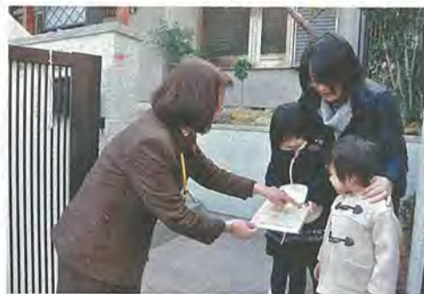
啓発チラシを配布する民生委員

委員は、福祉に対する理解と熱意のある市民を八幡市民生委員推薦会が推薦、京都府を経て厚生労働大臣が委嘱します。民生委員は、地域児童の健全育成を進める児童委員の役割も兼ねていることから、一般に「民生・児童委員」と呼ばれています。また児童問題を主に担当する主任児童委員も、各小学校区にそれぞれ配置されます。委員は福祉全般に関する困りごとや心配いこの相談を受けて指導・助言や各種福祉制度の紹介を行うなど、地域住民と行政のパイプ役として活躍します。