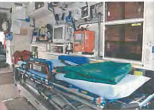
▲ 災害対応特殊救急自動車 ▼ 車内状況

搭載する高度救命処置用資機材の半自動除細動器・生体監視装置等を最新機種へ更新。新たに自動心臓マッサージ機を積載する等、救命活動に必要な資機材を増設しました。