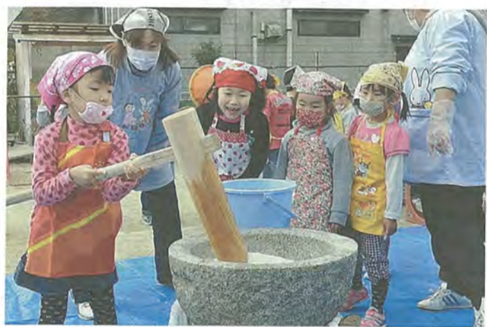
おもちつきをする園児たち

園児たちは、順番に大きな杵を持ち、ペッタン、ペッタンとおもちつき。見守る園児たちも元気な声で「よいしょ、よいしょ」の掛け声や、杵の重さに負けずと振り上げる姿に応援を送っていました。