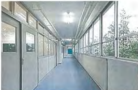
防滑性シートが貼られた廊下(北棟)

平成24年度の南棟改修工事に続いて中棟・北棟・屋内運動場の老朽改修工事を行いました。主な工事の内容は外壁改修、内装改修、建具の更新、照明器具更新などです。外壁の全面塗装改修、ひび割れ等の補修、普通教室・特別教室の壁、天井等の塗り替え、黒板および掲示板の張り替え、教室と廊下の間仕切りの撤去・新設、廊下および階段に防滑性シートの貼り付け、窓ガラスに飛散防止フィルムの貼り付け、照明器具の取り替えとあわせて、地震時の落下防止対策も行いました。