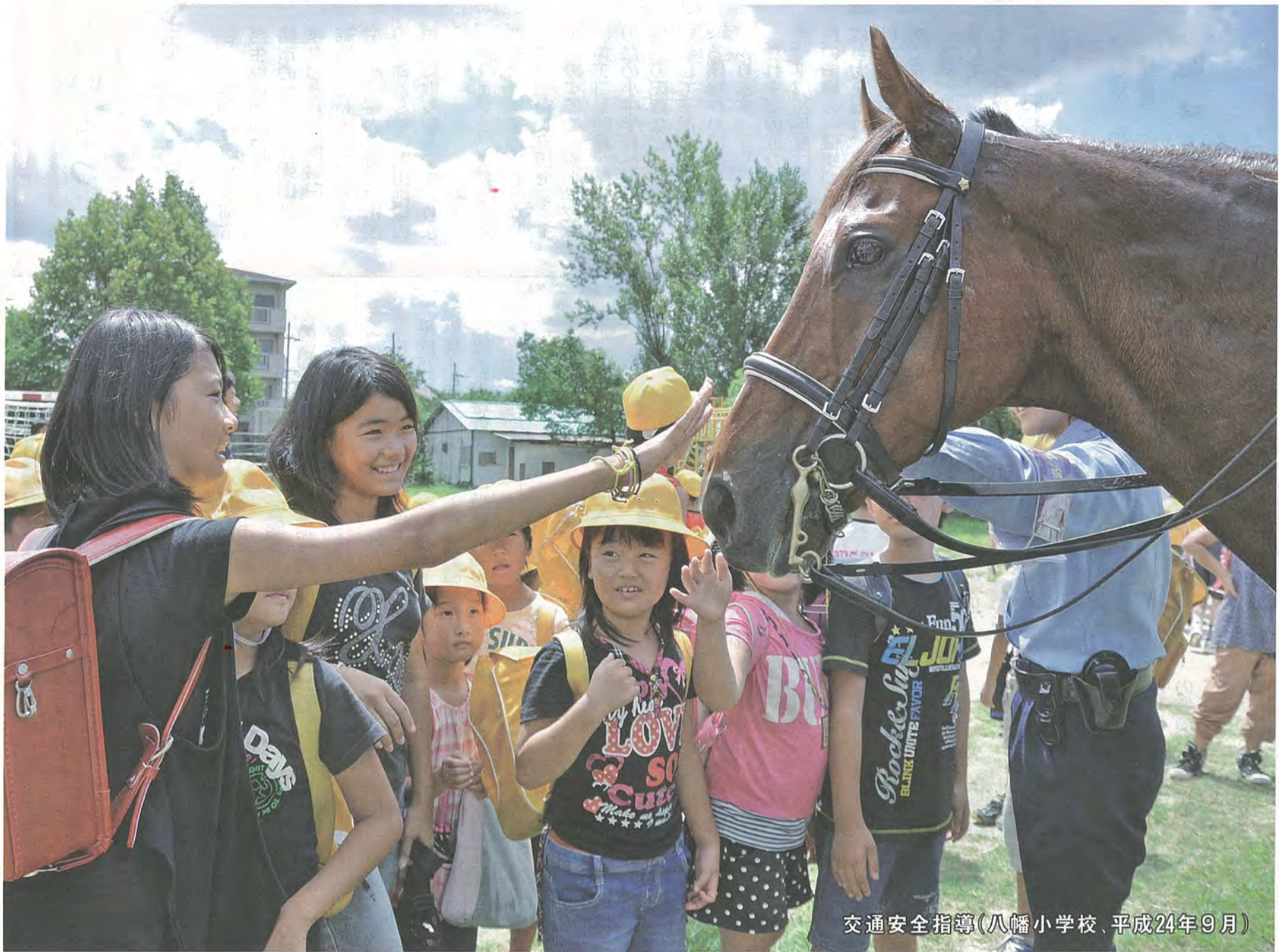
交通安全指導(八幡小学校、平成24年9月)