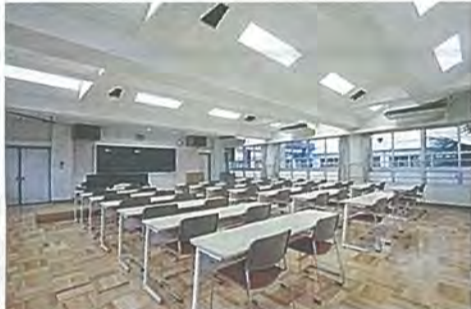
内装改修後の音楽室(中棟)

▽ 男山第二中学校 (中棟・北棟・屋内運動場) (工事費3億1千258万5千円)