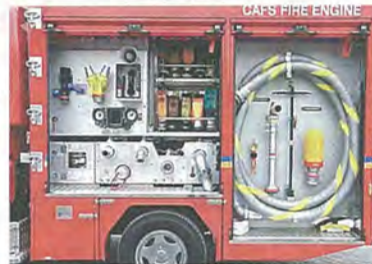
▲ 更新された消防ポンプ自動車 ▼ CAFS装置等

剤を加え、そこへ圧縮空気を送り込み発泡させ、その泡を放水して消火活動を行うことができるCAFS装置(圧縮空気泡消火装置)を搭載しています。泡にすることで、少量の水で効率よく消火が可能です。さらに