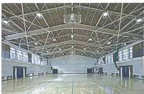
老朽改修後の屋内運動場

平成24年度の南棟改修工事に続いて中棟・北棟・屋内運動場の老朽改修工事を行いました。主な工事の内容は外壁改修、内装改修、建具の更新、照明器具更新などです。外壁の全面塗装改修、ひび割れ等の補修、普通教室・特別教室の壁、天井等の塗り替え、黒板および掲示板の張り替え、教室と廊下の間仕切りの撤去・新設、廊下および階段に防滑性シートの貼り付け、窓ガラスに飛散防止フィルムの貼り付け、照明器具の取り替えとあわせて、地震時の落下防止対策も行いました。