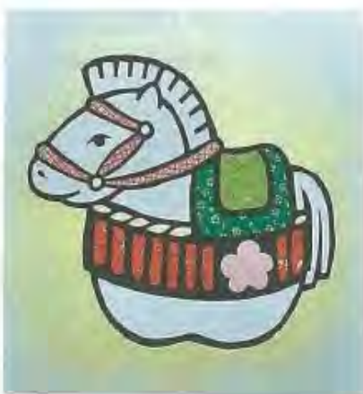
【切り絵】 「午 2014」(匿名希望)

※みなさんの作品で、広報やわたの紙面を飾ってみませんか。応募作品の一部を、このコーナーで紹介いたします。作品は俳句、川柳、短歌、イラスト、写真、詩など(写真、イラストに関しては、100字程度で説明を添えてください)。1人1作まで。毎月5日までに、住所、氏名(ふりがな)、電話番号を明記して、〒601-4850 市役所秘書広報課「作品」係へ送ってください。