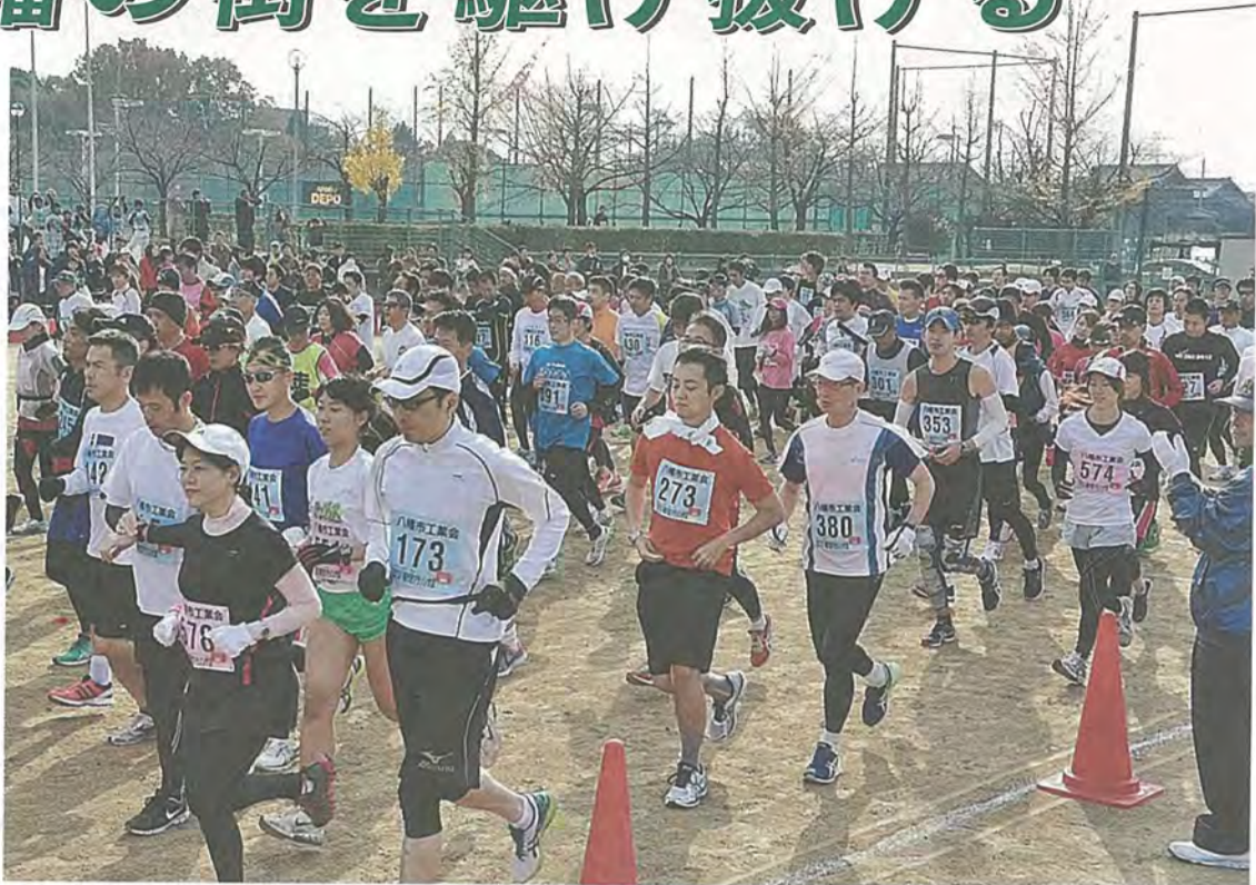
スタートするランナーたち

「2013八幡市民マラソン大会」が12月1日、八幡市民スポーツ公園を発着点に開催され、市内外から集まった1546人のランナーが八幡の街を駆け抜けました。