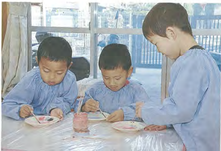
お皿に絵付けをする園児たち

ずつ置かれた絵の具を使うために、行ったり来たり。好きな色を使って、猫やハートなどの自分の好きな絵を、楽しそうにお皿に描いていました。絵付けが終わると、園児たちは「先生、見て見て」と、色とりどりの絵の具が上手にちりばめられたお皿を、うれしそうに見せていました。お皿は陶芸の先生が後日焼き上げ、進級のお祝いとして3月に園児たちへ贈られます。