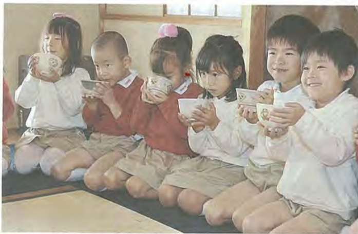
抹茶をいたたく園児たち

12月3日、八幡第三幼稚園の5歳児25人が、松花堂庭園の茶室「松隠」でお茶会を体験しました。