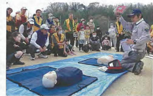
救命措置について学ぶ自治会員（美濃山地区）

つき大会など）や文化活動を行っています。清潔で快適な環境をつくるため、公園清掃や地域清掃、資源物回収など環境美化活動を行っています。