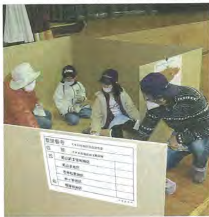
昨年の防災訓練の様子(くすのき地区)