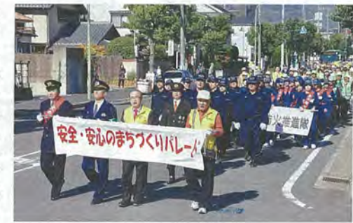
市自治連合会主催の「安全・安心のまちづくりパレード」