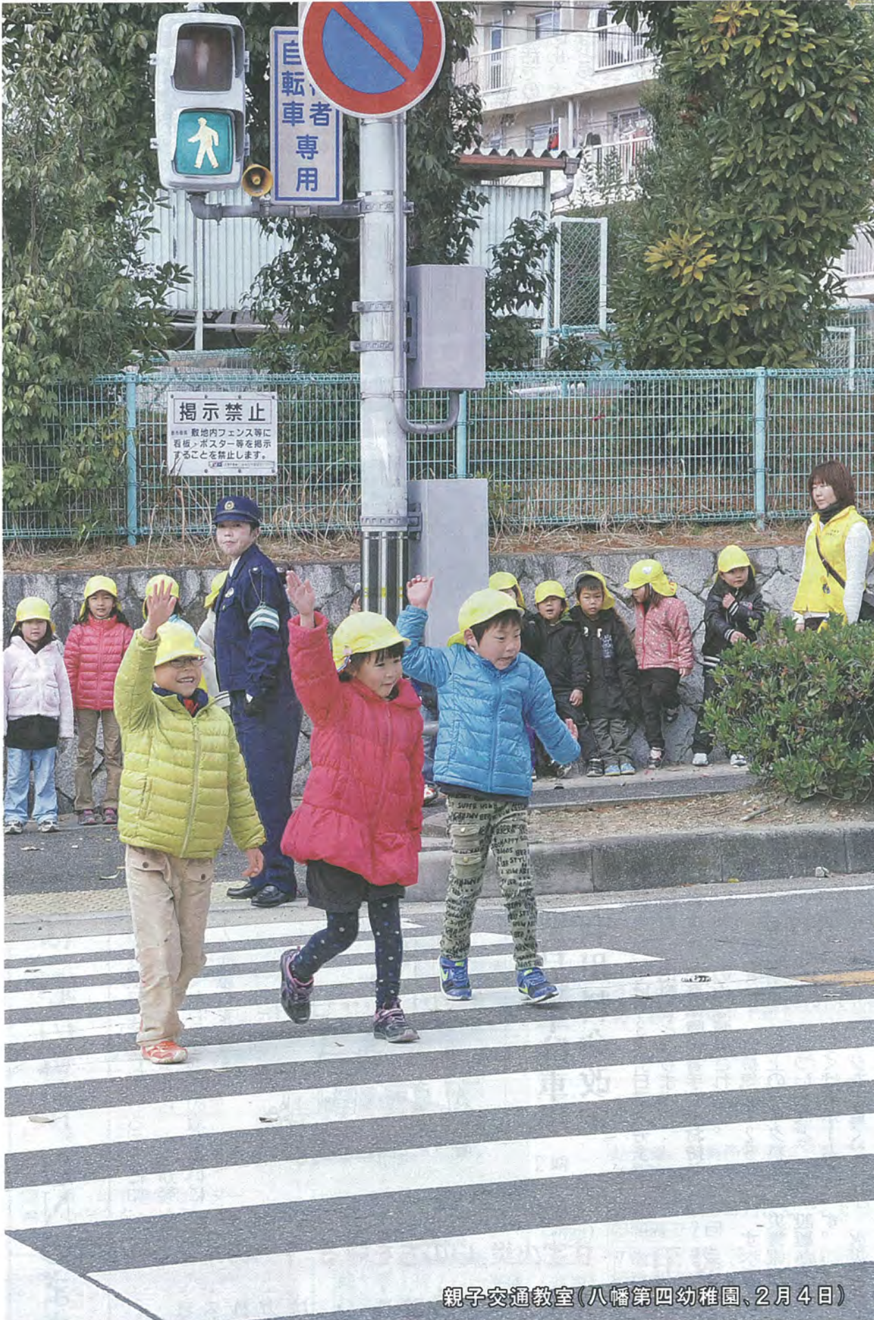
親子交通教室(八幡第四幼稚園、2月4日)