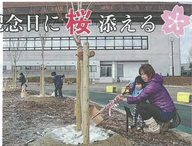
桜の木の根元に化粧砂を入れる参加者たち

2月16日、八幡市民スポーツ公園で桜の記念植樹が行われ、9組27人の市民が記念日の思い出作りに参加しました。 この取り組みは、子どもの誕生や還暦などの節目を記念した思い出作りと同時に、緑化への興味を持ってもらうとうと、八幡市公園施設事業団の主催で毎年行われており、今回で4回目になります。 また、将来的に桜の回廊づくりを目指しており、現在までに植えられた17本の桜の木に加えて、今回は9本が植樹されました。