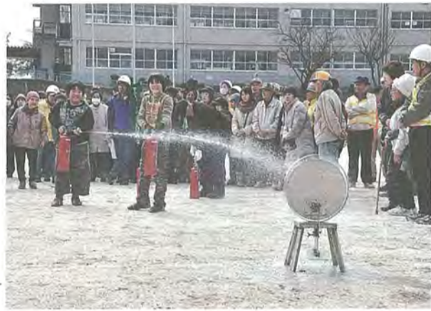
消火訓練を行う参加者