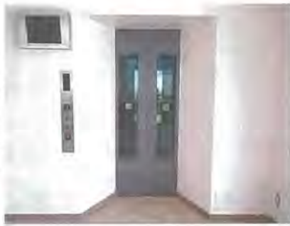
設置されたエレベーター

市では、土砂災害時の拠点避難場所である公民館の老朽改修やバリアフリー化を行い、より安全で使いやす