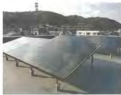
屋上に置かれた太陽光パネル

すい施設へと改善しています。このたび、志水公民館の改修工事を完了しました。主な内容は、以下のとおりです。