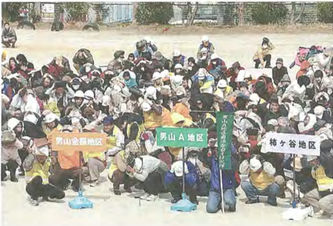
シエイクアウト訓練を行う参加者