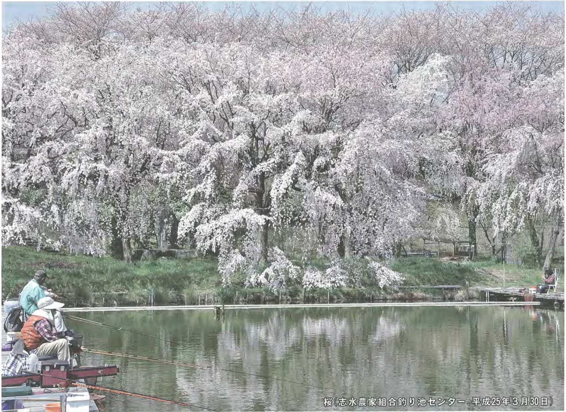
桜(志水農家組合釣り池センター、平成25年3月30日)