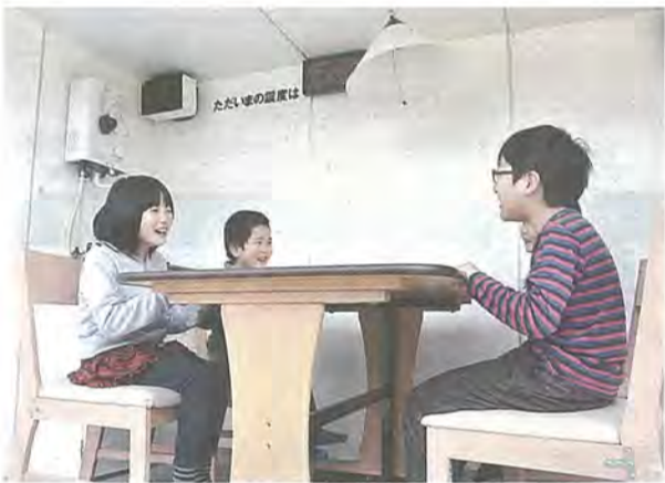
地震体験をする参加者