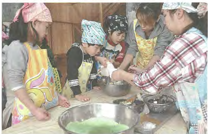
クッキーの生地を混ぜる園児たち

クッキーが焼き上がると、3時のおやつに親子と一緒に「いただきます」。園児たちは「チョコの味がいっぱいおいしい」と大満足。親子の会話も弾み、楽しい保育園の思い出になりました。