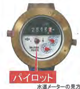
水道メーターの見方