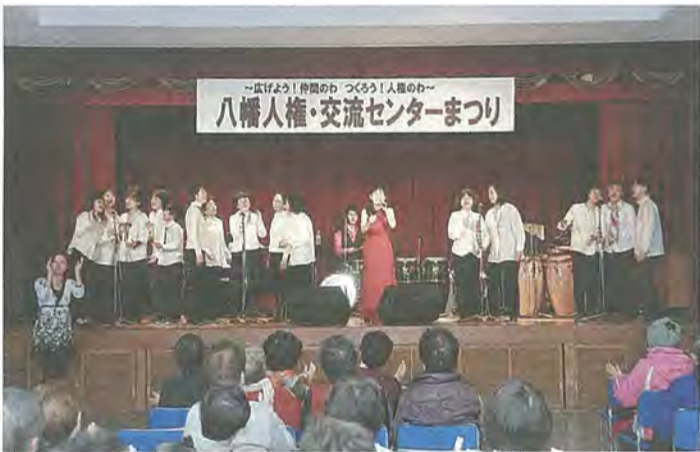
八幡人権・交流センターまつり