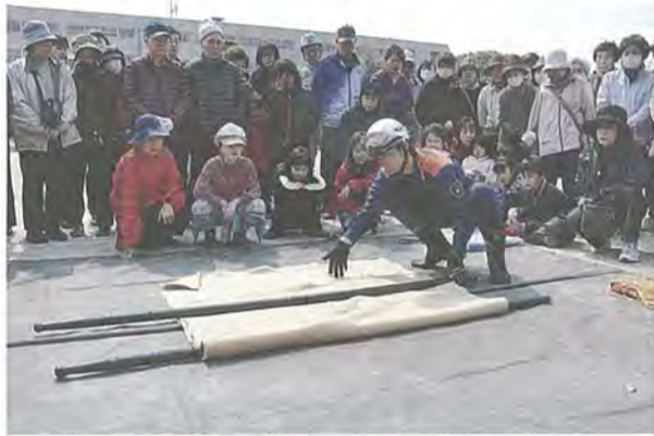
毛布での担架の作り方を学ぶ参加者