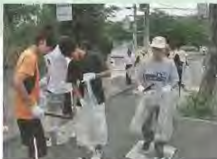
※雨天の場合は6月8日(日)に延期します。問合せ 環境業務課

市は6月1日(日)を「まちかどのごみ」ゼロの日として、道路や公園の清掃を実施します。ご協力いただける人は午前9時、活動しやすい服装で清掃(集合)場所にお集まりください。軍手やごみ袋は用意します。▽清掃(集合)場所 ①八幡市駅と放生川周辺(さざなみ公園に集合)②さくら近隣公園と松花堂周辺(さくら近隣公園ポケットパークに集合)