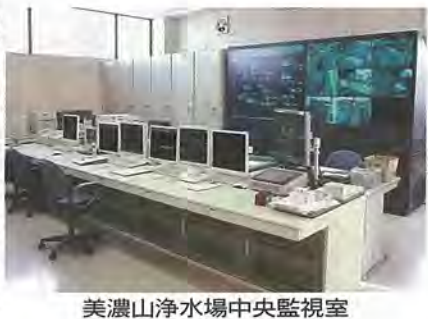
美濃山浄水場中央監視室

京都府産木材の利用拡大を目的として、住宅・店舗・事務所の増改築に、京都府産木材を使用した場合、木材購入費に助成をします。 木材は断熱性が高く、調湿作用がある、人に優しい 素材であり、再利用可能な資源で環境にやさしい素材です。 住宅等の増改築には、京都府産木材を利用しましょう。 ※木造住宅耐震改修費事業に活用できる場合があります。