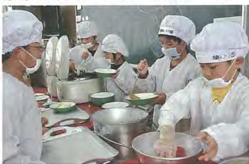
ご飯やおかずをよそう子どもたち

おいしい給食にみんなは口いっぱいほお張ります。食べ終わってしまうと、「おかわりください」と先生にお願い。食缶が空っぽになるまでモリモリ食べ、初めての給食に大満足でした。