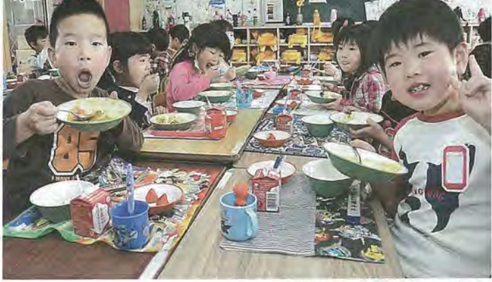
おいしい給食に笑顔の1年生有都小学校

4月16日、市内の各小学校で1年生の給食が始まりました。子どもたちは席を動かして班を作り、みんなで仲良く給食をいただきました。