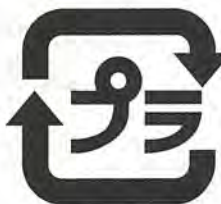
このマークが目印

食料品や日用品などの商品を買った時に使われているプラスチック製の入れ物(容器)や包み(包装)のことで、中身を使った後は、ごみとなってしまふものです。