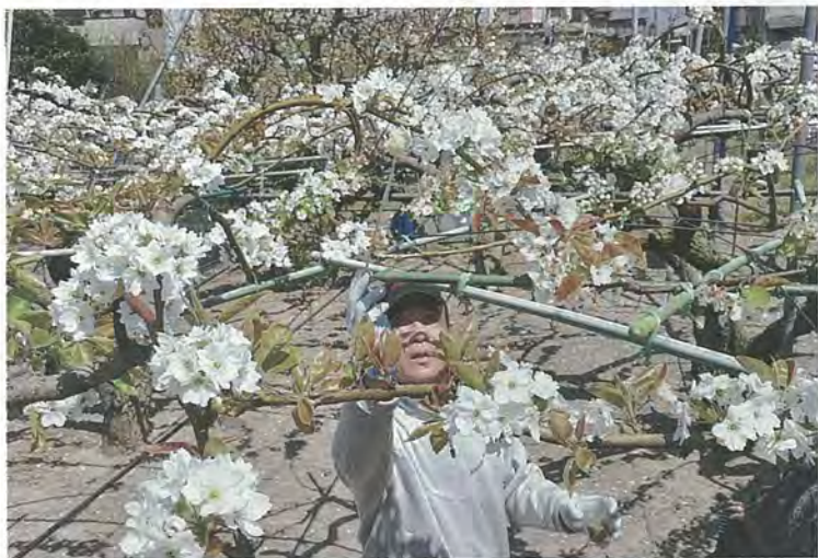
佳境を迎えたナシの人工授粉作業(4月15日)