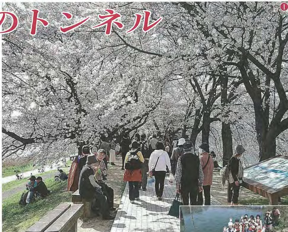
① たくさんの人でにぎわう背割堤 ② お花見船から手を振る来場者 ③ ジャグリングショーで拍手を送る来場者