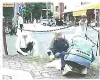
昨年6月の清掃活動の様子(八幡市駅周辺)

市は6月1日(日)を「まちかどのみ」ゼロの日として、道路や公園の清掃を実施します。ご協力いただける人は午前9時、活動しやすい服装で清掃(集合)場所にお集まりください。雨天の場合は6月8日(日)に延期します。