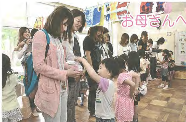
お母さんにプレゼントを手渡す園児たち