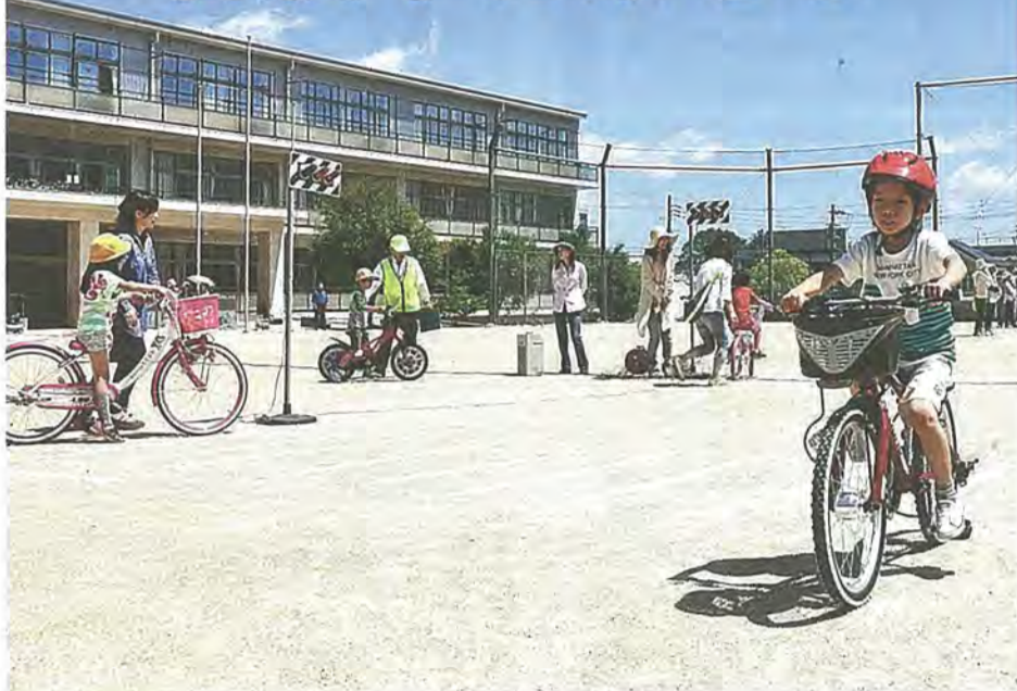
交差点を渡る練習をする児童たち

5月17日、美濃山小学校で自転車交通安全教室が行われ、参加した1年生から6年生までの児童約80人が、自転車の交通ルールを学びました。同教室は、児童に安全に自転車に乗ってもらおうと毎年行われてお