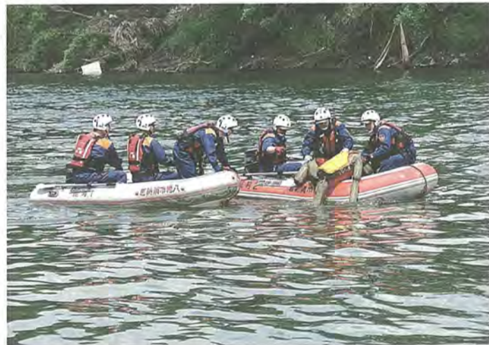
水難者に見立てた人形を引き上げる隊員たち

また、救命浮輪を発射する空気式救命索発射銃の発射方法も確認。遠方にいる水難者を救助する事態も想定して訓練しました。