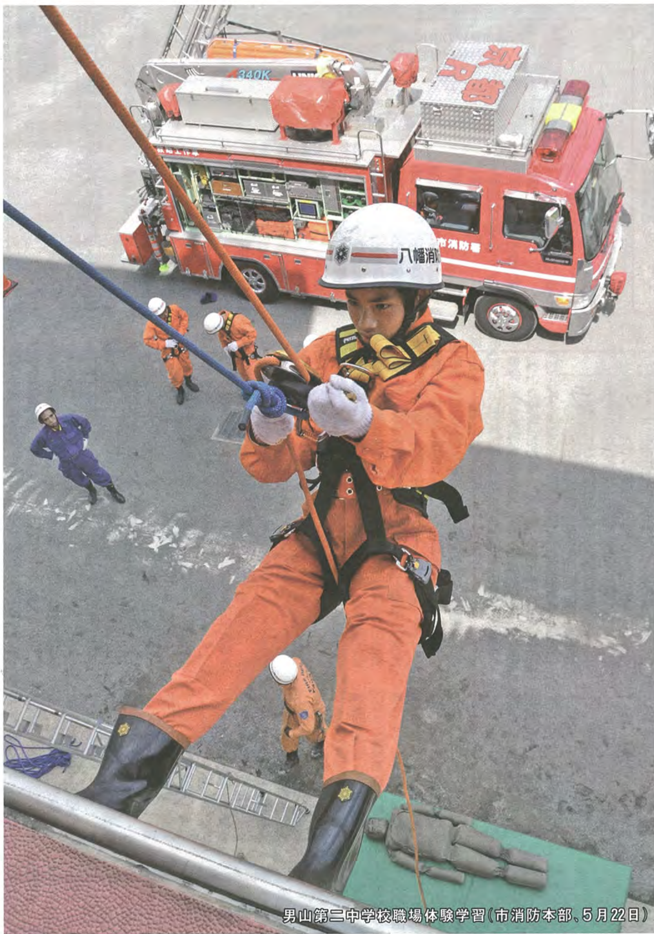
男山第三中学校職場体験学習(市消防本部、5月22日)