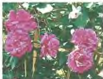
匿名希望(八幡園内)