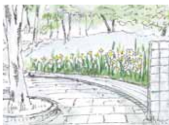
男山団地B地区の緑道沿いの花壇に咲く水仙。

緑道を歩くことが私の毎日の日課です。春頃、第二中学へ入るところに、水仙が列になって咲いていました。きれいな花が緑の中にところどころ咲いているのは、目休めにもなり、歩くのにもリズム感が出て疲れません。このような小さな花壇を、保育園や、小、中、高校、若者、大人達が、名札を立てて、四季を通じて世話をするのはどうでしょうか。長野県のある中学校では、学校改革のひとつとして花壇作りに取り組んだという事例を目にしました。荒れた中学を立て直すのに大いなる力を発揮したそうです。