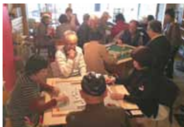
オリジナルの麻雀机は折畳んで片づけられるので、「欲しい」という声が多くの方から届いています！

初心者にもやさしく教えてくれる先生を募集しています！人数が足りない時があるので、ふらっと立ち寄ってくれる方も大歓迎！