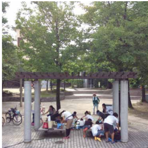
左：おひさまテラスの様子 右：おひさまテラス横の公園

「最近子どもが公園で遊ぶ姿を見なくなった」という声も聞こえています。子どもも大人も安心して集まれる場所を地域に増やしていきたいですね。