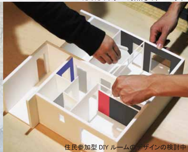
住民参加型DIYルームのデザインの検討中