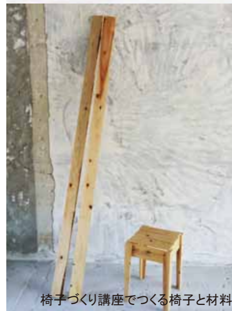
椅子づくり講座でつくる椅子と材料

主催 / だんだんテラスの会 協力 / 独立行政法人UR都市機構西日本支社 / トップテンハウス / 家具町LAB.