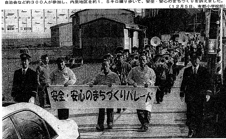
自治会など約300人が参加し、内里地区を約1.5キロ練り歩いて、安全・安心のまちづくりを訴えました。(12月5日、有都小学校前)

この日、同NPOから派遣された気象予報士2人が、子どもたちに地球温暖化について説明した。学習会は12月4日、都児センターで開かれた。NPO法人気象予報士ネットワーク(東京都)が主催で、気象予報士が子どもたちに地球温暖化について説明した。