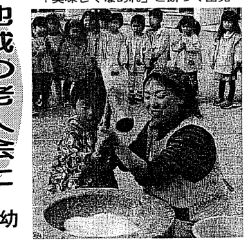
「美味しくなあれ」と餅つく園児

地域の老人会ともちつき交流 八幡第四幼 正月前に餅つきで交流した。八幡第四幼稚園の子どもたちと、地域の老人会が12月17日、近くの老々クラブの会場で餅つきをした。子どもたちは、おはようおじさんや地域の活動で、児童会では「あいさつがなくなれば寂しい」と話している。昨年10月、児童会「あいさつがなくなる子が多いので、できる限りあいさつ運動を始めよう」と話し、あいさつ運動の重要性を話し、おはようおじさんや地域の活動で、児童会では「あいさつがなくなれば寂しい」と話している。