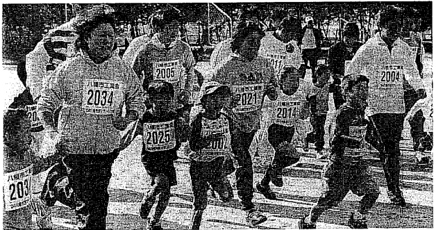
ハーフのほか、10キロ、5キロ、3キロ、2キロマラソンが行われました