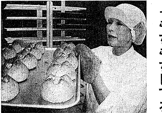
「もちもちしている」と好評

「四季彩」を拠点に活動するNPO法人「京・流れ橋食彩の会」は、米粉を使った新しい食品を開発し、販売を始めた。