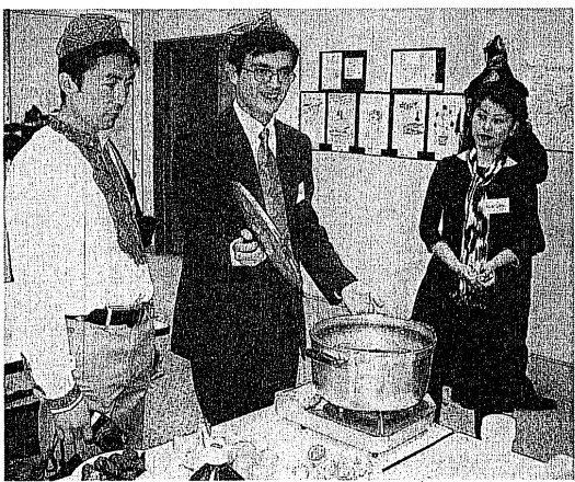
ウイグルの民族料理が、会場を訪れた参加者全員にふるまわれました