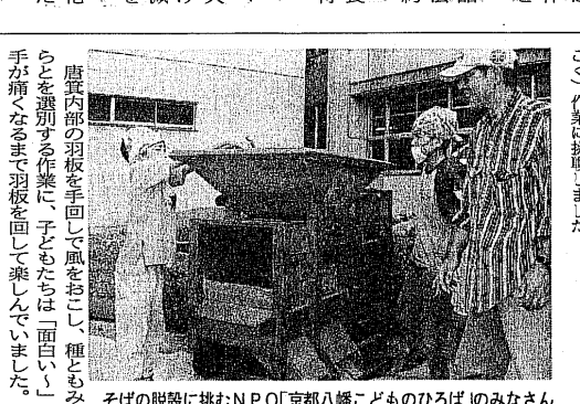
その日の脱履に挑むNPO「京都八幡子どものひろば」のみなさん

「四季彩」を拠点に活動するNPO法人「京・流れ橋食彩の会」は、米粉を使った新しい食品を開発し、販売を始めた。