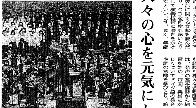
八幡市民オーケストラと合唱団 マーラー「復活」に挑戦