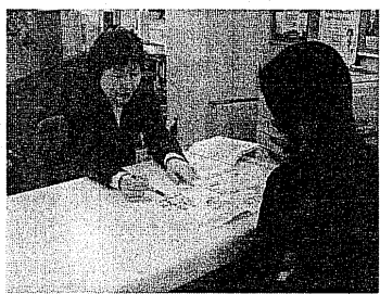
公的資格を持つ専門の相談員が対応