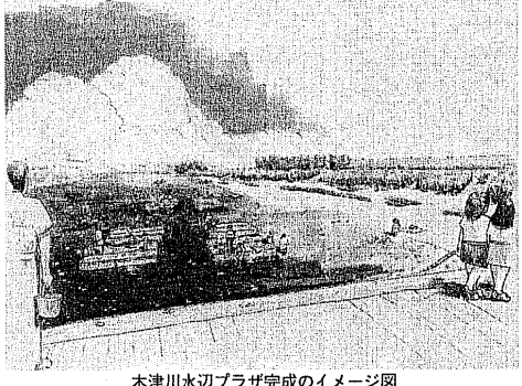
木津川水辺プラザ完成のイメージ図

市民会議でワークショップ開催 男山地域の活性化に参画 地域づくり活動がより広範に推進される取り組みを進めています。 「市民会議」では、昨年11月24日に住民説明会を開催し、男山地域の将来構想について、市民から多くの意見が寄せられました。また、この「市民会議」で、男山地域の活性化を図るための取り組みを進めています。