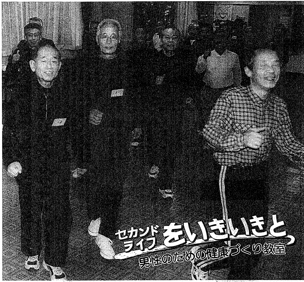
セカンドライフをいきいきと ライフをいきいきと 男性のための健康づくり教室

い(退)職後のセカンドライフをより健康に楽しく過ごすための健康づくり教室を開いて。市では『男性のための健康づくり教室』を開いて。同教室は4回シリーズで、第1回は「自分の身体を見つめてみよう」、第2回は「アルコールの上手な飲み方」を学びました。 いきいきと過ごすために「自分の体力を知ろう」と、2月9日に第3回が母子健康センターで開催され、60歳代中心の男性18人が参加。体力測定、ストレッチ、体操などを行い、「体力の衰えを痛感した。これ以上できるだけ低下しないようにしたい」「身体の状態を数値で知ることができた」と話していました。 う(量)と質が測定できるライフコーダリ(生活習慣記録機)を約2週間装着して第4回に運動データの分析を行います。 くも大事なことです。日々の生活活動の充実そのものがセカンドライフをいきいきと楽しく過ごす秘訣であると実感されていました。