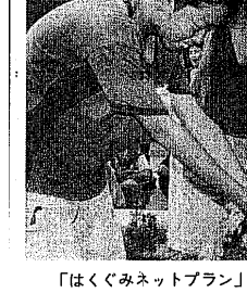
「はぐみネット」事業の井戸づくり (東小)

はぐみネットは、地域住民の生活環境を改善するための取り組みです。井戸の整備は、地域の衛生と健康を守る重要な取り組みです。