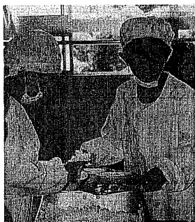
従前どおり握え置かれる給食費

子育て支援の充実 次、「子どもたちの明るい未来を育む」ことを目指し、子育て支援の充実を最優先課題として、協力をいただければ幸いです。