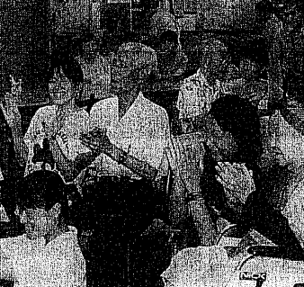
昨年に行われた市内中高生の福祉施設体験学習

高齢者も障害者も全ての市民が安心して暮らせる福祉の充実 医療の進歩に伴って、高齢者も障害者も安心して暮らせる福祉の充実を最優先課題として、協力をいただければ幸いです。