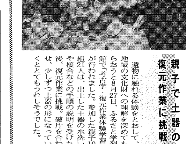
親子で土器の復元作業に挑戦

親子で土器の復元作業に挑戦 遺物に魅了される体験を通して、地域の文化への理解を深めてもらう。お年寄りと一緒に土器の復元作業に挑戦した。お年寄りは、おじいちゃん、おばあちゃん、いつまでも元気でいてねと、園児たちに励まされた。