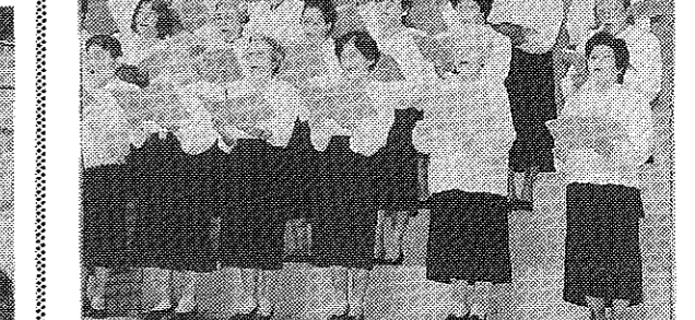
会場いっばいに響く美しい歌声

お母さんより私の方が名コック 親子のふれあいを深めてもらう。お母さんより私の方が名コックと、親子で料理の楽しさを体験した。お母さんは、おじいちゃん、おばあちゃん、いつまでも元気でいてねと、園児たちに励まされた。