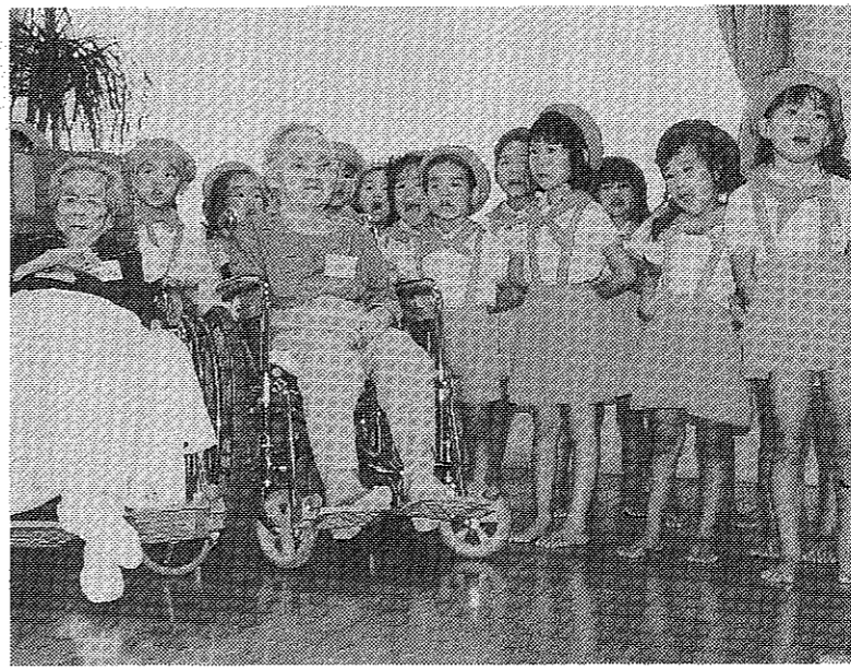
お年寄りを囲み歌を披露する山鳩保育園の園児たち

9月15日は、「敬老の日」。保育園や幼稚園では、お年寄りと一緒に世代を超えた交流が、特別養老ホームでは、敬老祝賀会が催された。