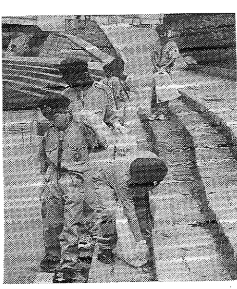
清涼活動を行うボーイスカウト(放生川周辺)

サマーキャンプで大きな成長 子どもたちの自立心を育てるための活動。サマーキャンプで大きな成長を遂げた。子どもたちの自立心を育てるための活動。サマーキャンプで大きな成長を遂げた。