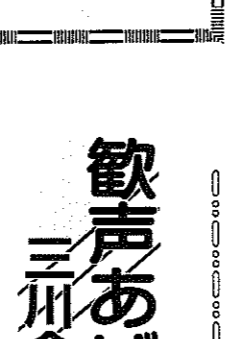
ふるさとを思い出すための活動

ふるさとを思い出すための活動。ふるさとを思い出すための活動。ふるさとを思い出すための活動。ふるさとを思い出すための活動。