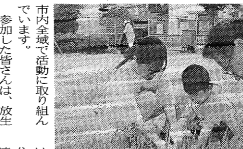
自治会でも道路や公園の清掃を実施(安原塚自治会)

美しくて住みやすい環境を、市民が手を取り合って実現しよう。ごみを一掃、まちかどごみゼロの日運動が、今年7回目となる。市民がごみを拾い、ごみゼロの日運動が、今年7回目となる。市民がごみを拾い、ごみゼロの日運動が、今年7回目となる。