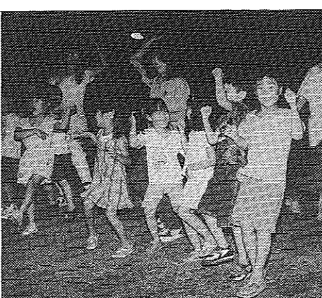
子どもたちの自立心を育てるための活動

希望 希望のお願い。松花堂昭栄没後36年特別展が、10月11日より開催される。松花堂昭栄没後36年特別展が、10月11日より開催される。