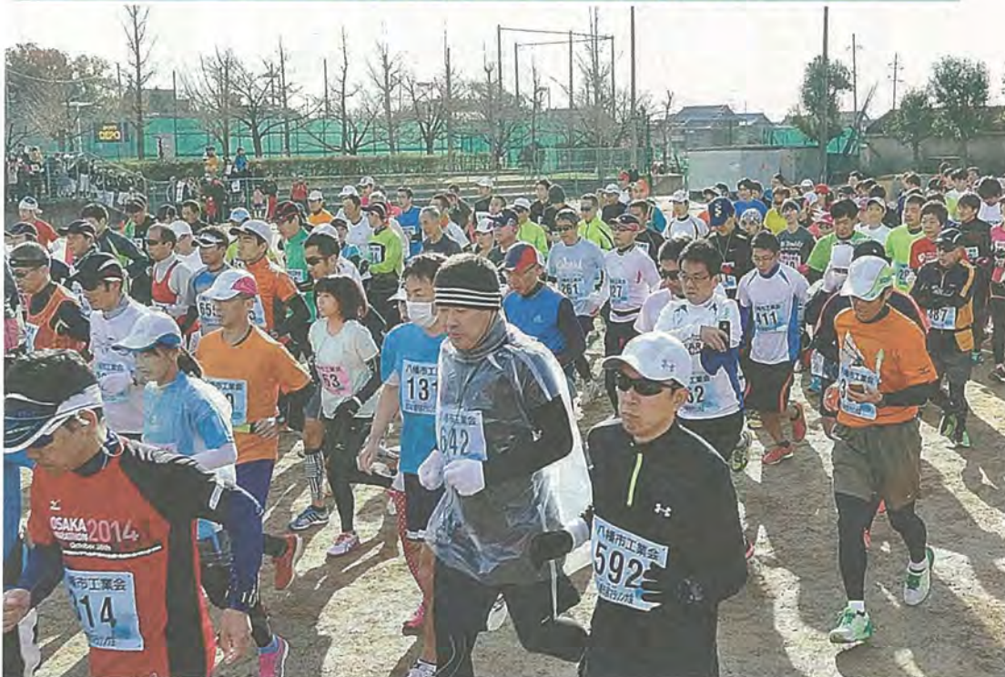
スタートを切るランナーたち

「2014八幡市民マラソン大会」が12月7日、八幡市民スポーツ公園を発着点に開催されました。