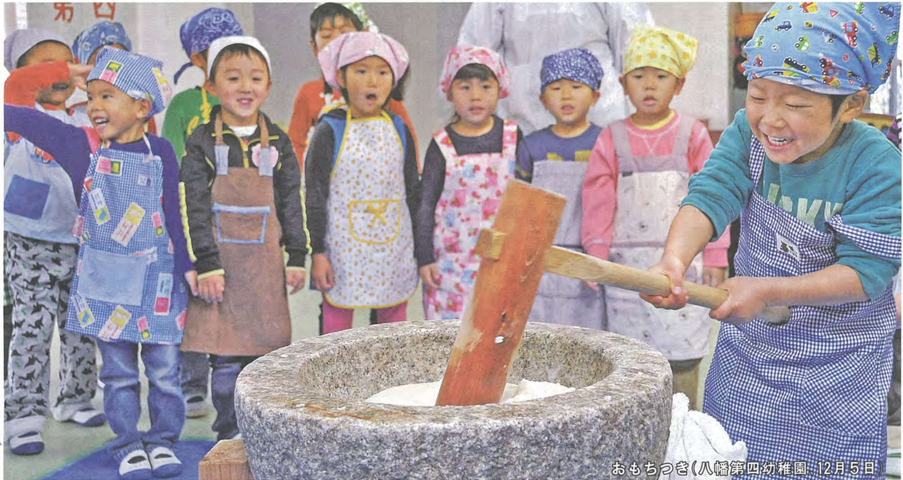
おもちつき(八幡第四幼稚園 12月5日)