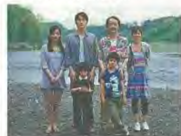
2013年「そして父になる」制作委員会

第二部受付で引換券配布し、閉会式終了後に引き換え)。 ※入場無料。当日直接会場へお越しください(先着順)。