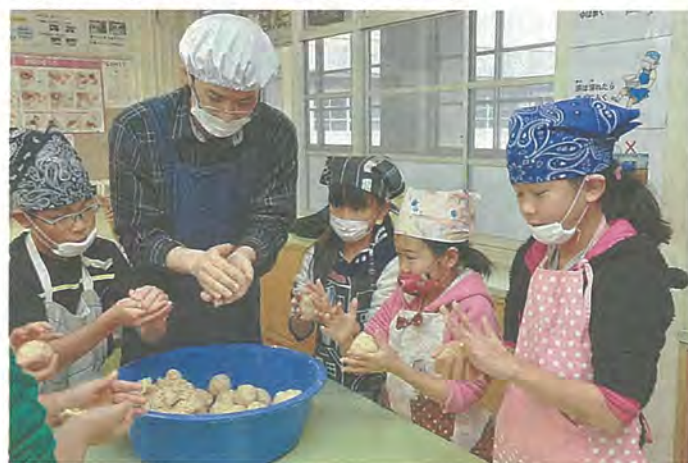
みそを丸める児童たち

仕込んだみそは、約1年間寝かせ、来年の家庭科の授業や給食で使われる予定で、児童たちはみそが完成するのを心待ちにしていました。