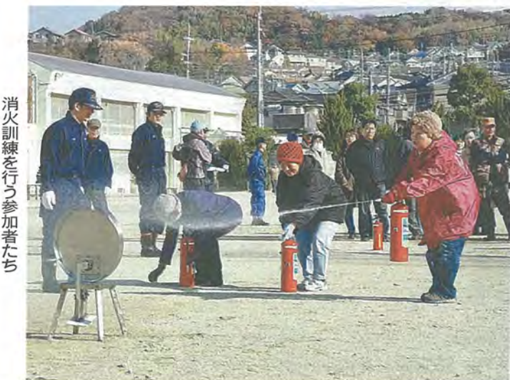
消火訓練を行う参加者たち

が長い「ヘソヒコーキ」。同社員から「翼は正面から見るとYの形にすると、飛ばしたときに空気抵抗でまっすぐになり、よく飛びます」などのアドバイスをもらいながら、手順に沿って丁寧に折り、自分だけの折り紙ヒコーキを完成させていました。 最後は、距離ごとにポイントを決め、クラス対抗の折り紙ヒコーキ競技会。児童たちはクラスの声援を受けながら、折り紙ヒコーキをより遠くへ飛ばそうと頑張っていました。