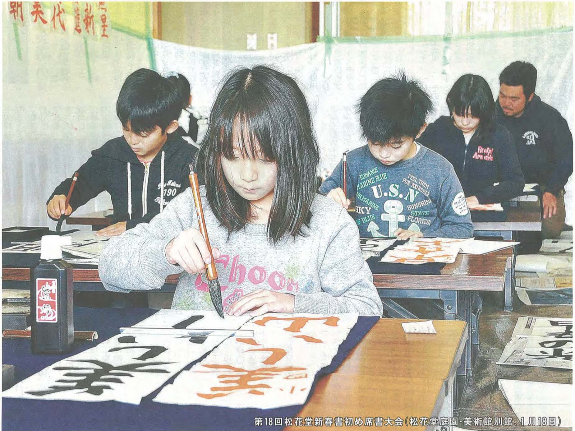
第18回松花堂新春書初め席書大会(松花堂庭園・美術館別館、1月18日)