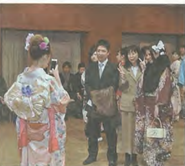
④晴れ着姿で会場に集まる新成人たち ⑤恩師と写真を撮る新成人

新成人の門出を祝う「成人式」が1月12日、文化センター大ホールで行われました。振り袖や羽織袴、スーツに身を包んだ新成人467人(対象者663人)が出席し、成人としての新たな一歩を踏み出しました。