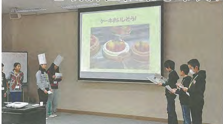
寸劇を交えて「スイーツマップ」を提言する小学生班