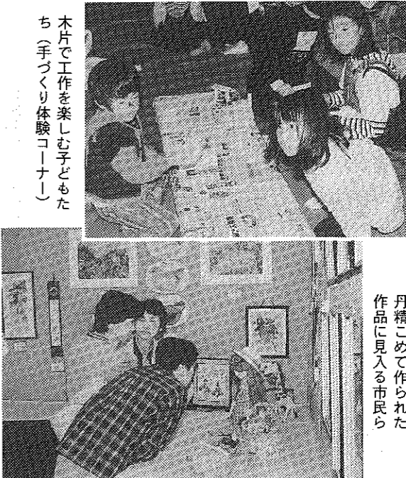
丹精こめて作られた作品に見入る市民ら