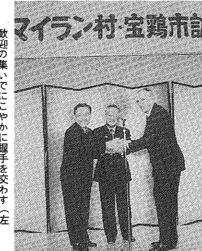
歓迎の集いでにぎやかに握手を交わす。左から宝鷄市代表、松花堂市長、マイラン村長

市制施行20周年記念式典に招待した、アメリカのマインラン村長と中国の宝鷄市の代表らが10月31日と11月1日、それぞれ市役所を表敬訪問しました。