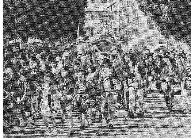
パレードを盛り上げた第五区・川口区のみこし