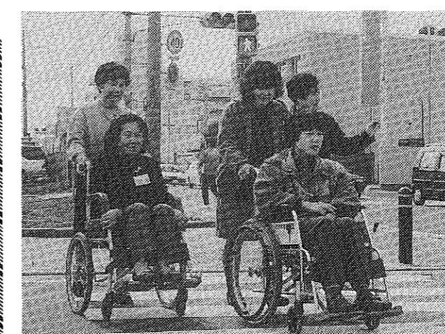
実際にまちに出て介助方法の実習をする参加者