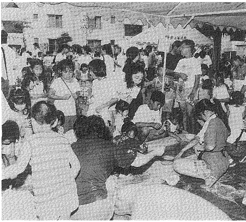
自治組織では、住民相互の親睦を深めていくため、各種のレクリエーション活動にも取り組んでいます(写真は、昨年のB地区自治会の夏まつり)