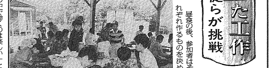
協力し合って竹を切る児童ら

竹を使った工作を、児童・生徒らが挑戦しました。 竹を使った工作を、児童・生徒らが挑戦しました。