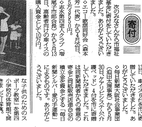
ボールを使った運動に汗を流す参加者

ボールを使った運動に汗を流すスポーツ教室を開催しました。 ボールを使った運動に汗を流すスポーツ教室を開催しました。