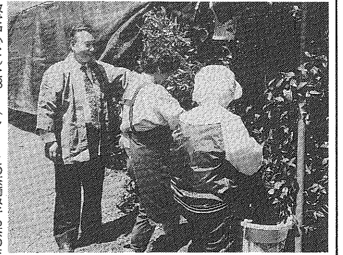
茶園を訪れ摘み手さんと話している市長

茶摘みシーズン中の6月18日、八幡市長が市内の製茶工場と茶園を視察し、茶の生産者や摘み手さんへの労をねぎらい、激励した。 摘み取られた茶をボイラーで乾燥し出す製茶工場では、5月中旬から6月初旬にかけて、茶園で摘み取られた新茶が次々と運ばれてきた。乾燥機が回っている音が、この日、工場を訪れた市長らに響き渡った。 工場を訪れた市長らに、摘み手さんへの労をねぎらい、激励した。市長は、摘み手さんへの労をねぎらい、激励した。市長は、摘み手さんへの労をねぎらい、激励した。