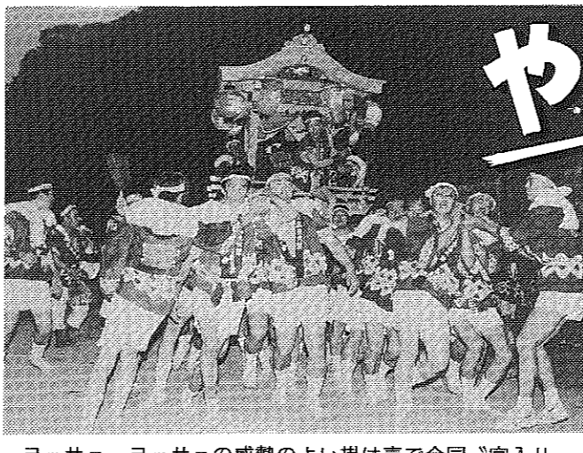
ヨッサ、ヨッサの威勢のよい掛け声で合同「宮入り」。

「ヨッサ、ヨッサ、ヨッサ、ドン、ドン、ドン」八幡の夏、到来を告げる「太鼓まつり」が、7月17日(土)の夜、市内各地で行われました。勇壮な屋形太鼓(太鼓舟)が市内を練り歩き、今年も多くの市民が祭りの気分を酔いしれました。 夏本番。京都では、祇園祭の山鉦巡行が行われ、八幡でも勇壮な屋形太鼓(舟形太鼓)が市内各地を練り歩きました。 太鼓舟の中心は、白丁太鼓と、おどりの太鼓の両方があるのが特徴です。太鼓舟の中心には、おどりの太鼓と、おどりの太鼓の両方があるのが特徴です。 おどりの太鼓は、おどりの太鼓と、おどりの太鼓の両方があるのが特徴です。おどりの太鼓は、おどりの太鼓と、おどりの太鼓の両方があるのが特徴です。