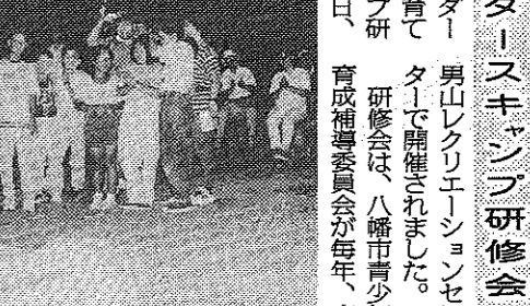
市内の小学生から中学生までの児童を対象に、地域リーダー育成研修会が実施された。

青少年のリーダーシップ研修会。野外活動を通じて地域リーダー育成。青少年のリーダーシップ研修会が、7月28日(土)に、市内各地で行われました。 野外活動を通じて地域リーダー育成。青少年のリーダーシップ研修会が、7月28日(土)に、市内各地で行われました。