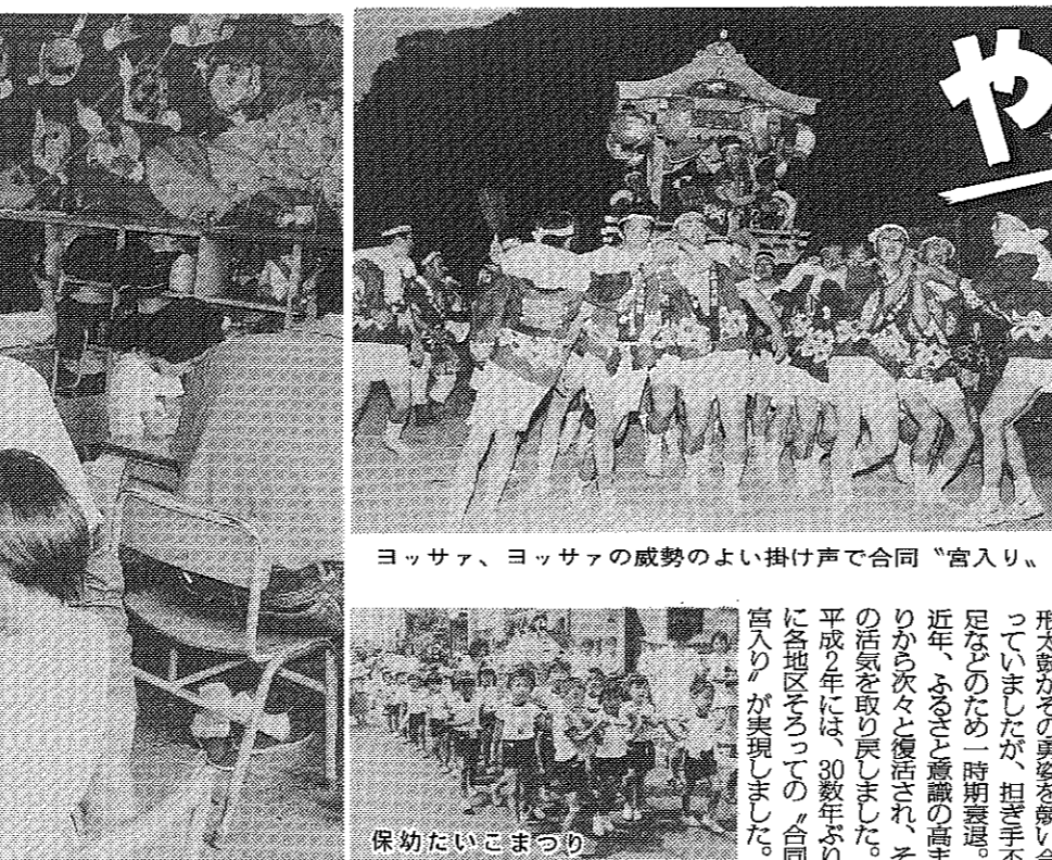
ヨッサ、ヨッサの威勢のよい掛け声で合同「宮入り」。

文化センター大ホール。8/31(土)開演 午後6時。文化センター大ホールで公演が行われます。 8/31(土)開演 午後6時。文化センター大ホールで公演が行われます。