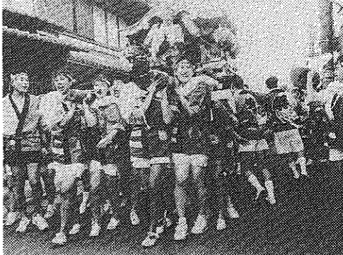
40人の祭り大好きギャルが担ぐ「女性みこし」

男山団地にも初の屋形太鼓。今年のはじめ、初めて男山団地に屋形太鼓が練り歩きました。17日の午後、男山団地の公民館で、男山団地地区の有志が中心となり、市内各地で行われた「太鼓まつり」に合わせ、男山団地でも初の屋形太鼓が練り歩きました。 17日の午後、男山団地の公民館で、男山団地地区の有志が中心となり、市内各地で行われた「太鼓まつり」に合わせ、男山団地でも初の屋形太鼓が練り歩きました。