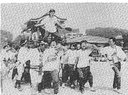
全校生徒が参加した男山中「校内たいこ祭り」

「ヨッサ、ヨッサ、ヨッサ、ドン、ドン、ドン」八幡の夏、到来を告げる「太鼓まつり」が、7月17日(土)の夜、市内各地で行われました。勇壮な屋形太鼓(太鼓舟)が市内を練り歩き、今年も多くの市民が祭りの気分を酔いしれました。 夏本番。京都では、祇園祭の山鉦巡行が行われ、八幡でも勇壮な屋形太鼓(舟形太鼓)が市内各地を練り歩きました。 太鼓舟の中心は、白丁太鼓と、おどりの太鼓の両方があるのが特徴です。太鼓舟の中心には、おどりの太鼓と、おどりの太鼓の両方があるのが特徴です。 おどりの太鼓は、おどりの太鼓と、おどりの太鼓の両方があるのが特徴です。おどりの太鼓は、おどりの太鼓と、おどりの太鼓の両方があるのが特徴です。