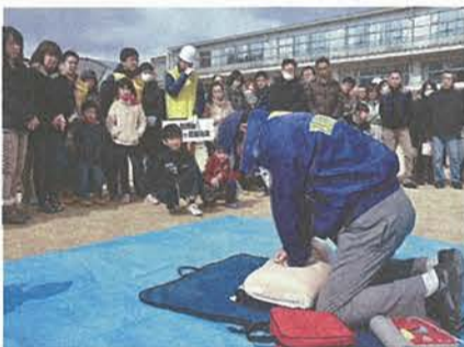
昨年の防災訓練での救命措置体験の様子(美濃山地区)

今年も3月1日(日)に、くすのき地区で、3月15日(日)には、美濃山地区で防災訓練が予定されています。