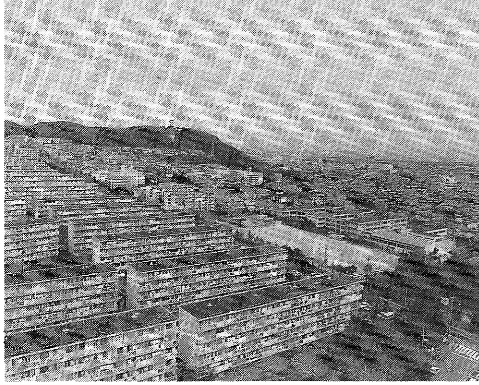
「基本構想」の理念にそい、独自の個性を持ち、さらに成熟したまちづくりの実現をはかります。