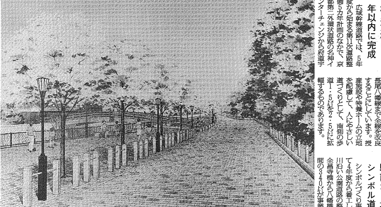
放生川沿いの「放生の景」事業は5年度で完成。引き続き、市役所へ至る1000mをシンボルロードとして、整備計画に着手します。

2つの工業団地へ力を入れる 2つの工業団地に力を入れている。工業団地の整備は、地域の活性化と経済成長を促進するための重要な取り組みである。また、工業団地の整備は、市民の生活の利便性を向上させることにも貢献している。