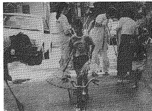
家族そろって清掃に参加(山田町)

「まちかどのごみ〇ゼロの日」は、市内各所で大掃除が行われ、市民ぐるみのクリーン運動が展開された。この日は、市内各所で大掃除が行われ、市民ぐるみのクリーン運動が展開された。この日は、市内各所で大掃除が行われ、市民ぐるみのクリーン運動が展開された。