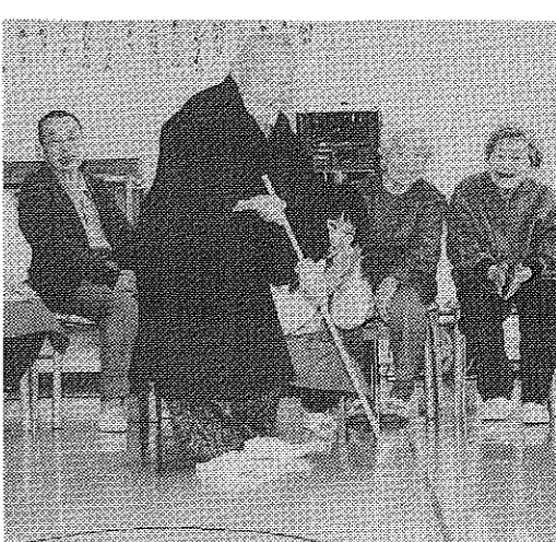
デイ・サービスでゲームを楽しむお年寄りたち

「たすけあいのまがてら」は、障害者の生活の質を向上させることを目的として、福祉制度の充実を図ります。また、障害者の生活を支えるための様々なサービスを提供します。 障害者のための福祉制度 障害者の生活の質を向上させるために、福祉制度の充実を図ります。 障害者のためのサービス 障害者の生活を支えるために、様々なサービスを提供します。