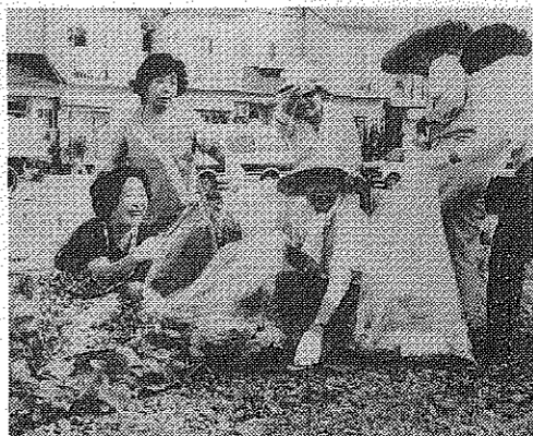
多量なゴミを回収する市民(八幡北町)