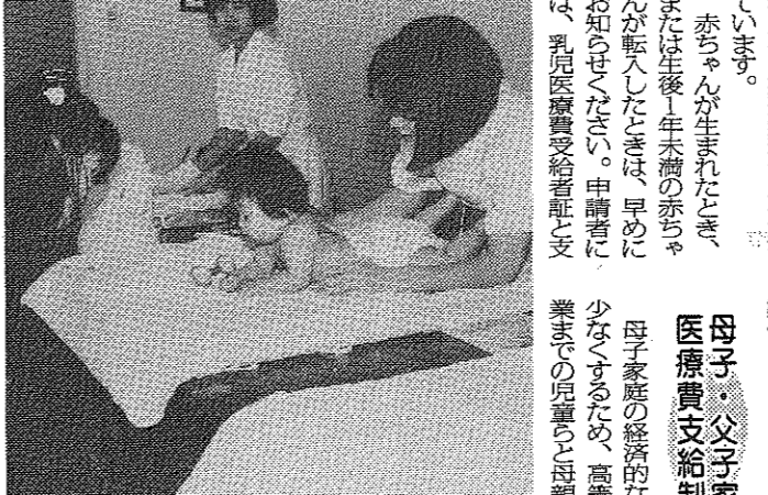
次代を担う子供たちはまちの貴重な財産

「児童・母子のために」は、児童と母子の生活の質を向上させることを目的として、福祉制度の充実を図ります。また、児童と母子の生活を支えるための様々なサービスを提供します。 児童のための福祉制度 児童の生活の質を向上させるために、福祉制度の充実を図ります。 母子のためのサービス 母子の生活を支えるために、様々なサービスを提供します。