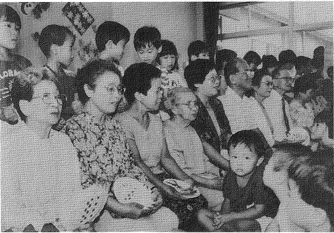
子供からお年寄りまで、だれもが安心して暮らせるまちづくりを推進します(わかたけ保育園)。