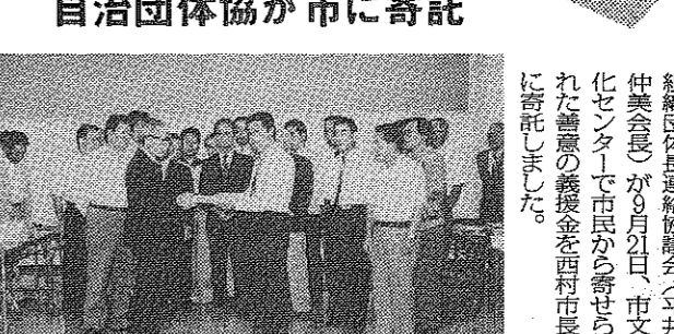
市長へ義援金を手渡す平井会長

「雲仙岳被災者」への義援金を、自治団体協が市に寄託しました。市長は、被災者への支援を歓迎しました。