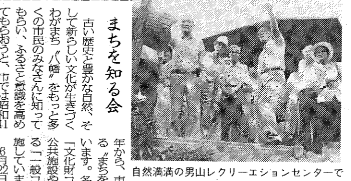
自然満々の山山レクリエーションセンターで