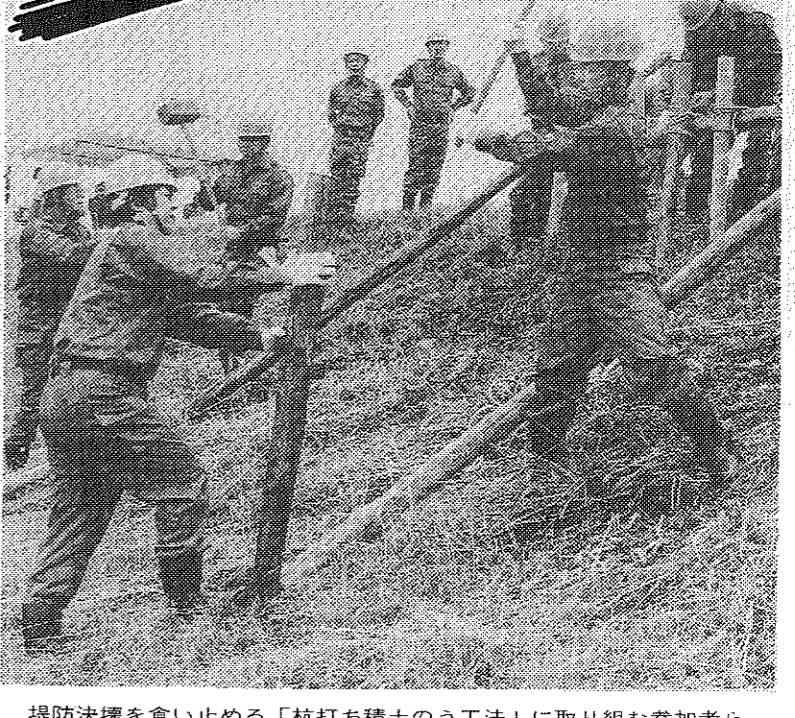
堤防決壊を食い止める「杭打ち積土のう工法」に取り組む参加者ら